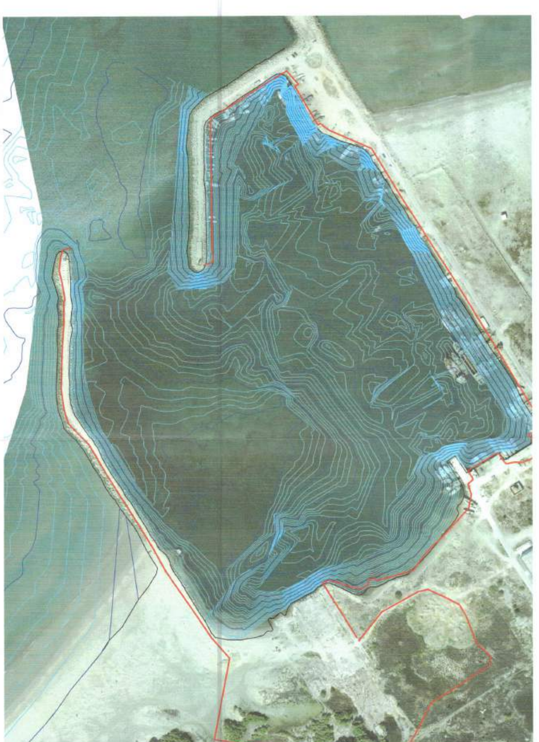
HARTA TOPOGRAFIKE SHK. 1:2500

TREGUESIT E ZHVILLIMIT: Sipërfaqe e përgatitshme e zonës për zhvillim Sipërfaqe tregëtare ku vendoset impianti i gnomoshtim : 256,605 m 2 Sipërfaqe ujore e prekur nga projekti: 13,328 m 2 Faqja e instaluar e impianteve: 10,800 m 2 110 MWp