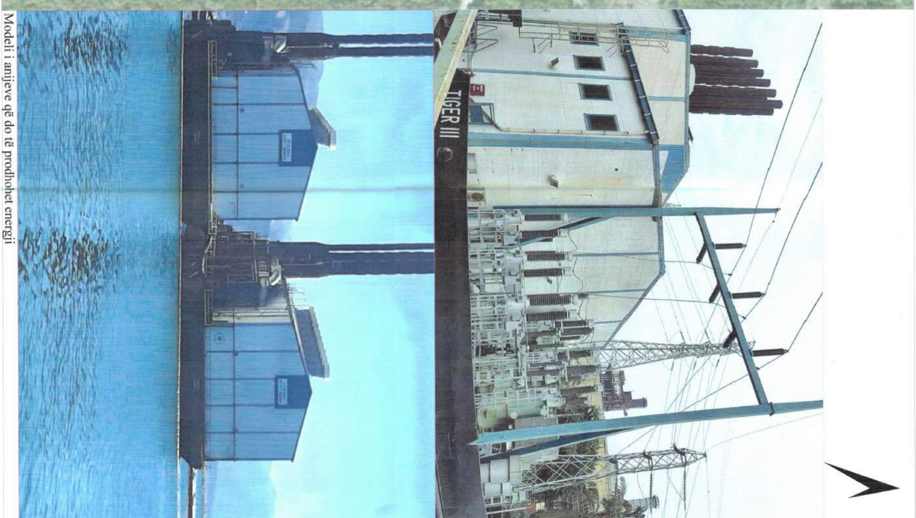
Modeli i anijëve që do të prodhohet energji