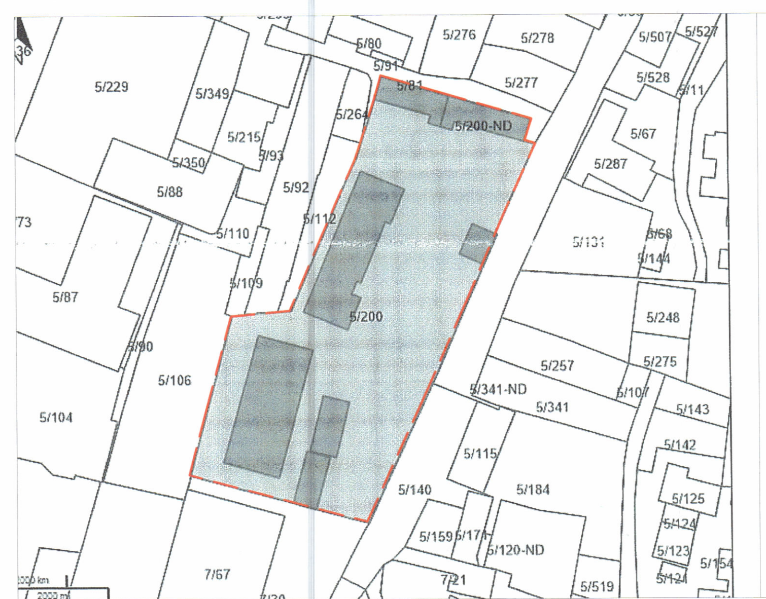
POZICIONI KADASTRAL SHK. 1:1000