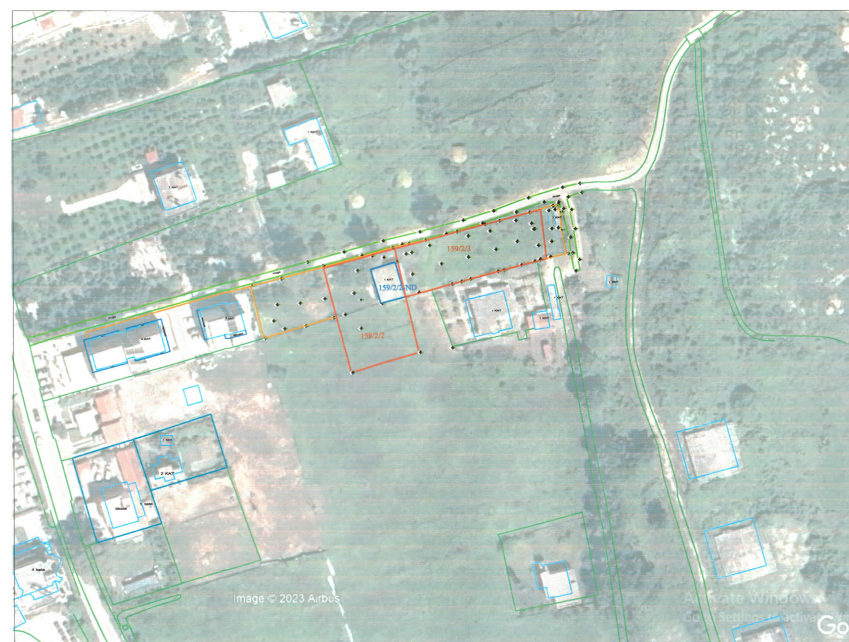
HARTA TOPOGRAFIKE SHK. 1:1000