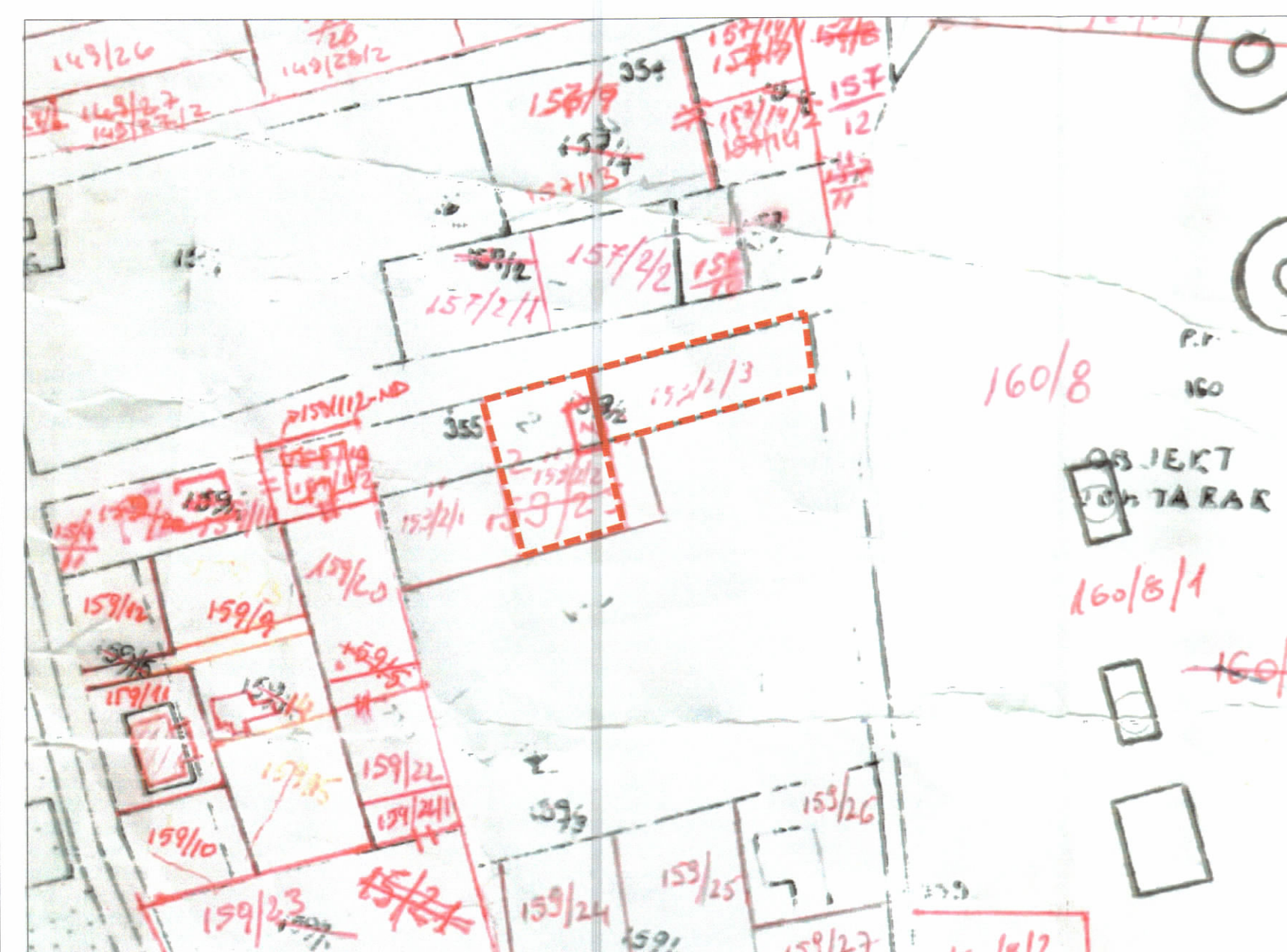
POZICIONI KADASTRAL SHK. 1:1000