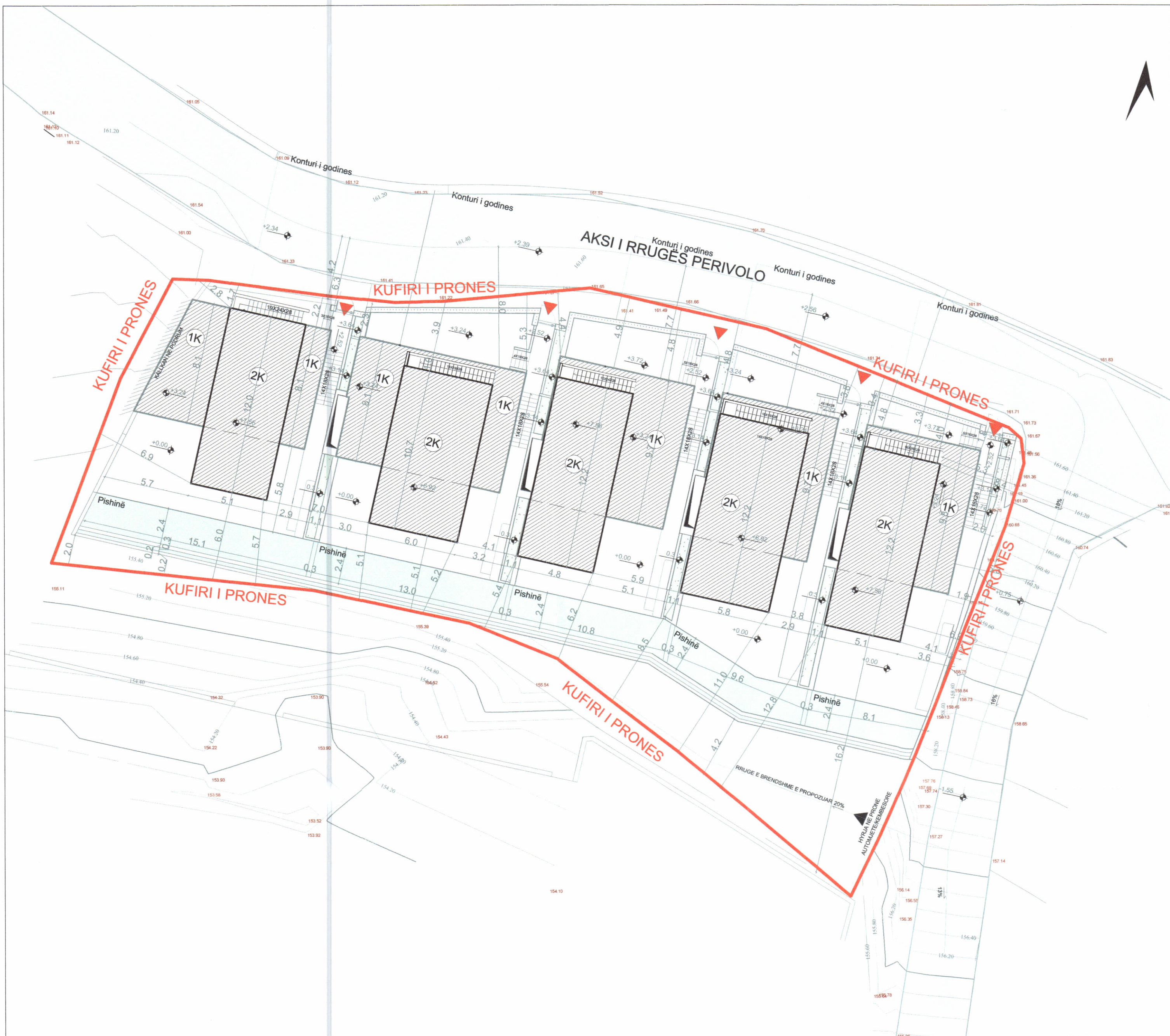
PLANI I VENDOSJES SË STRUKTURËS SHK. 1:200