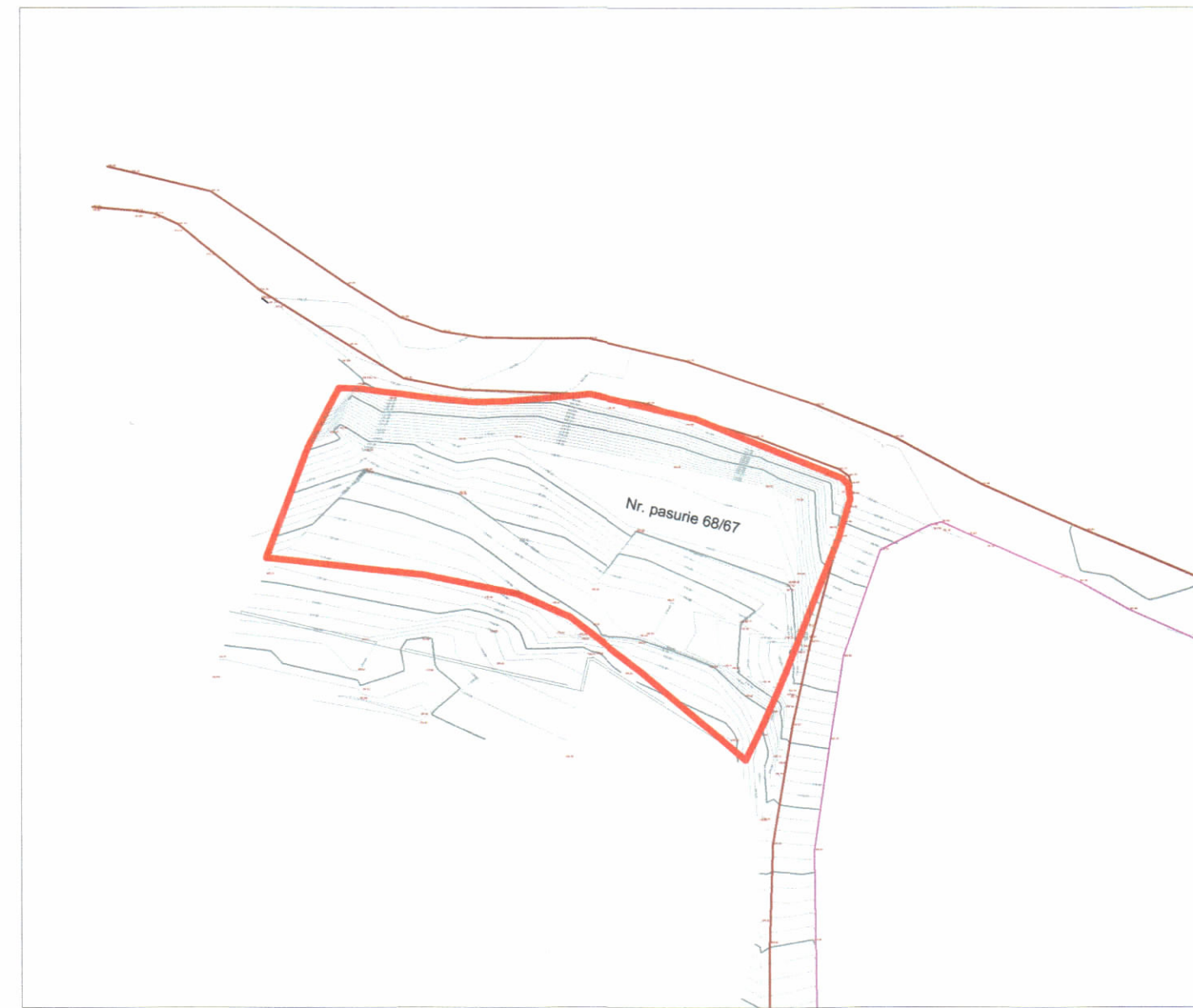
HARTA TOPOGRAFIKE SHK. 1:750