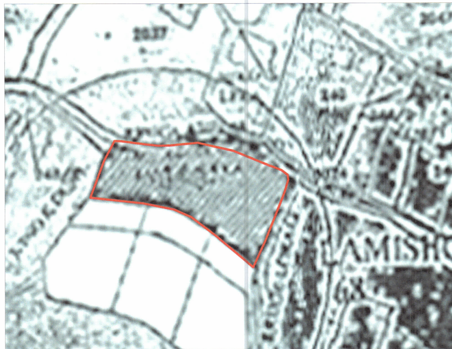
POZICIONI KADASTRAL SHK. 1:750