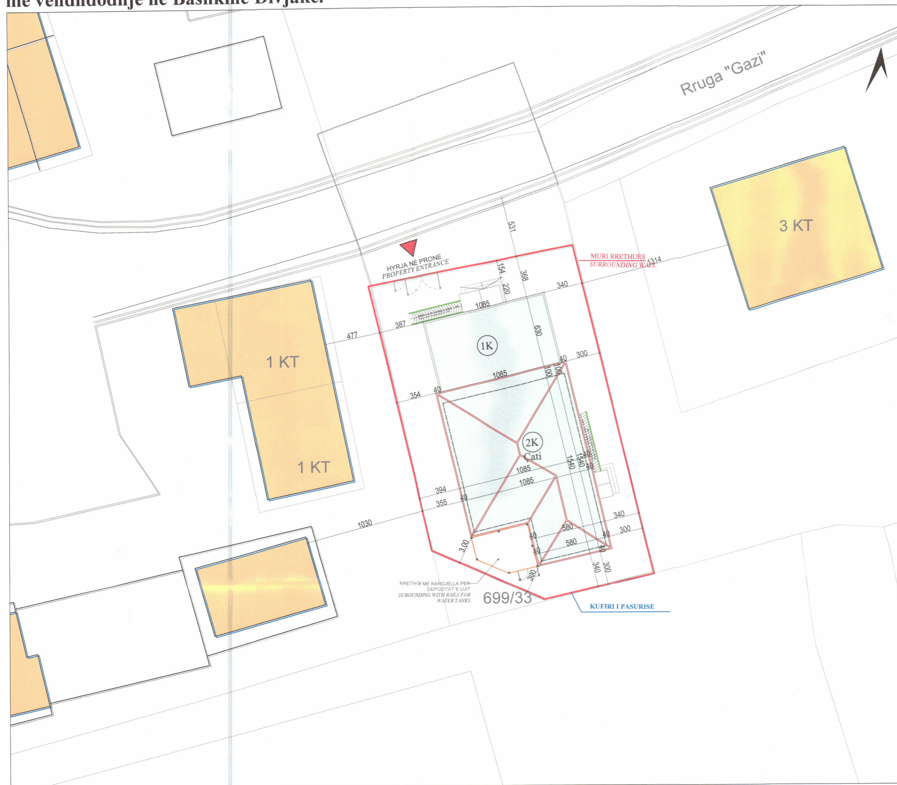
PLANI I VENDOSJES SË STRUKTURËS SHK. 1:200