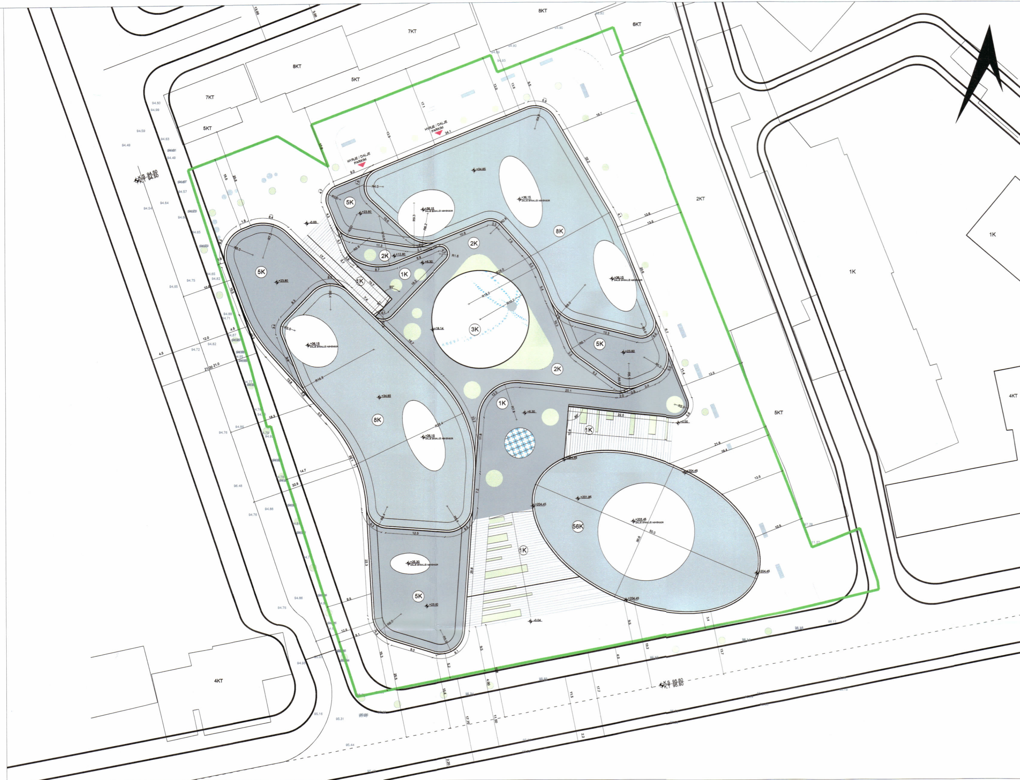
PLANI I VENDOSJES SË STRUKTURËS SHK. 1:350