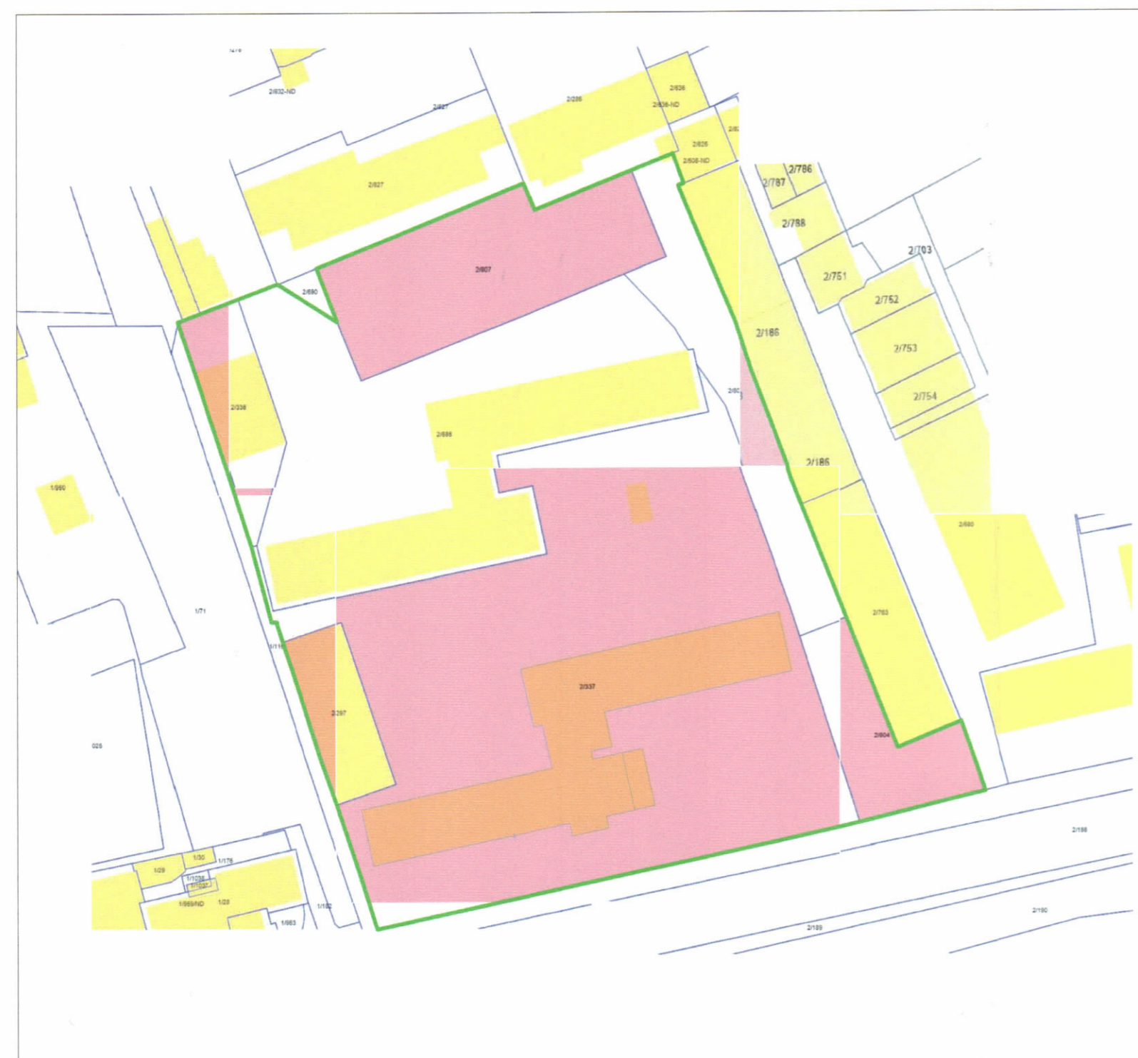
HARTA KADASTRALE SHK. 1:1000