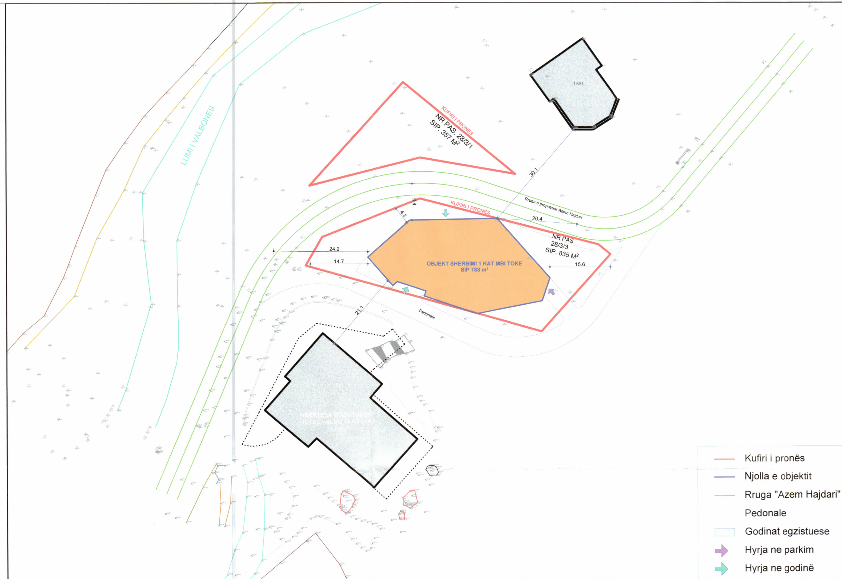
PLANI I VENDOSJES SË STRUKTURËS SHK. 1:400