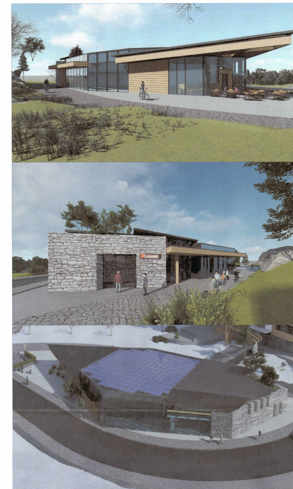
PAMJE TRE DIMENSIONALE