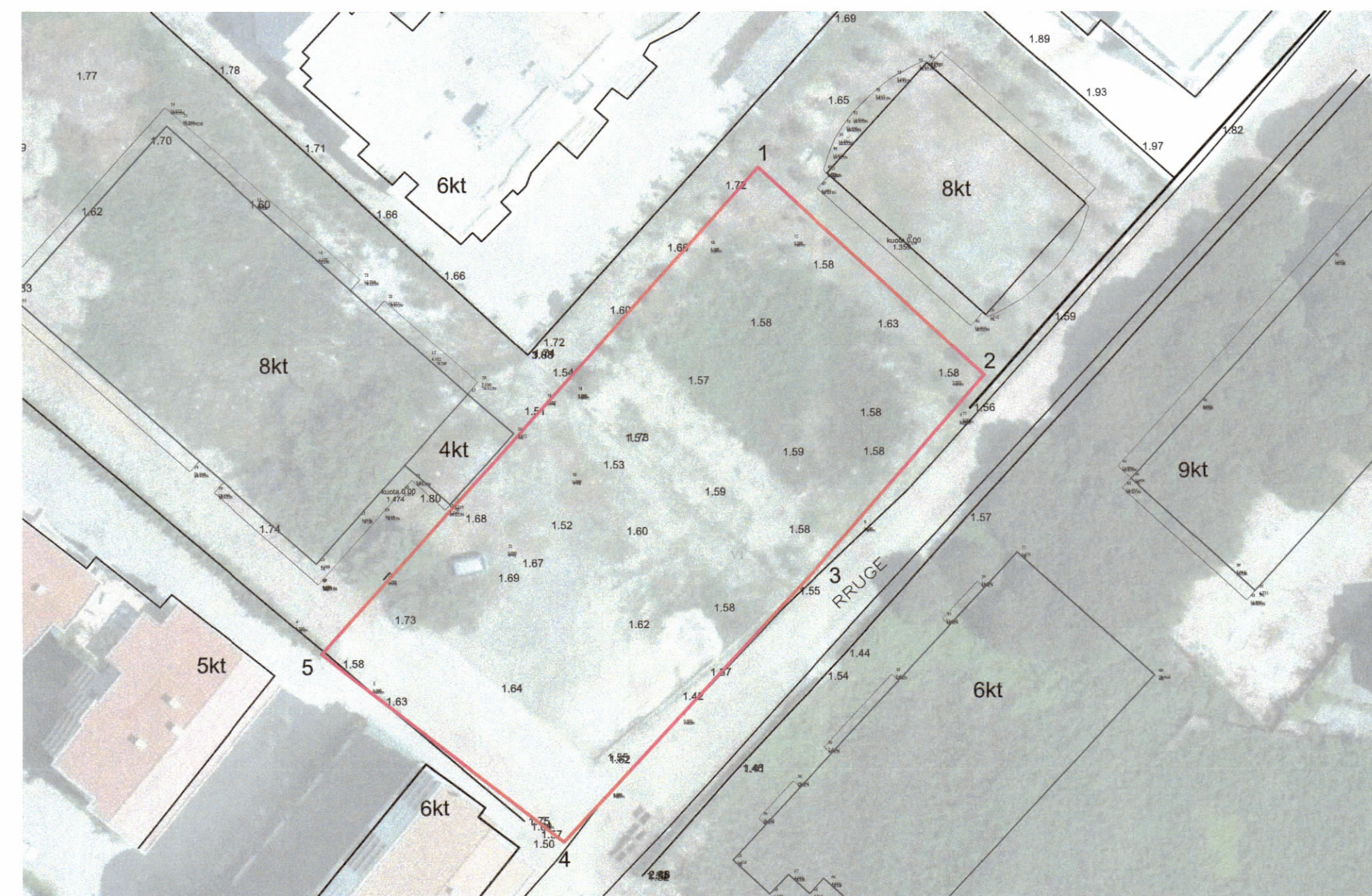
HARTA TOPOGRAFIKE SHK. 1:500