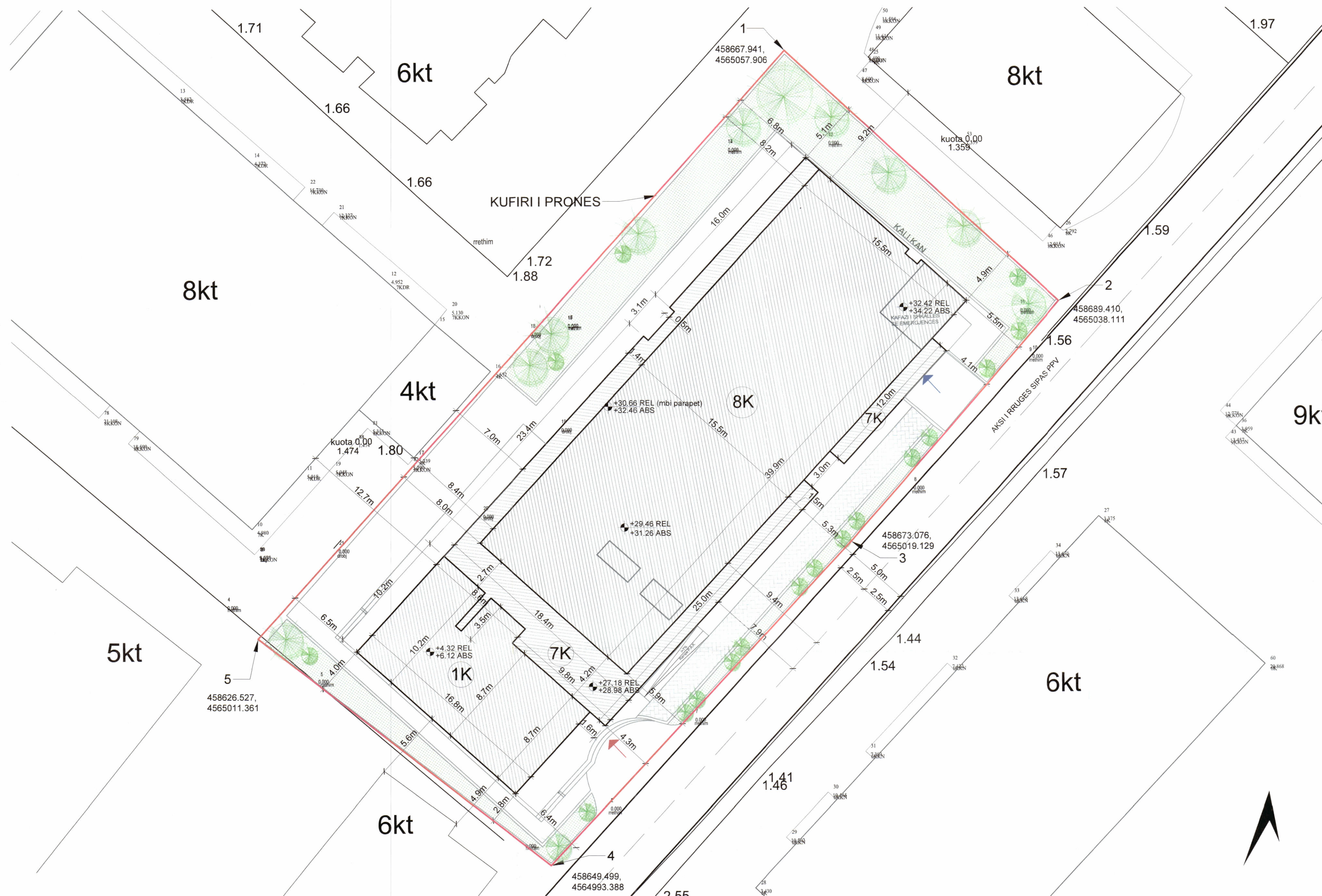
PLANI I VENDOSJES SË STRUKTURËS SHK. 1:200