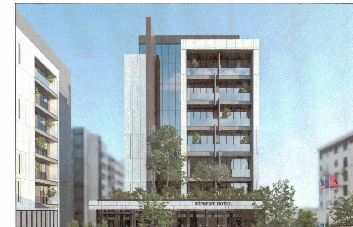
PAMJE 3 DIMENSIONALE