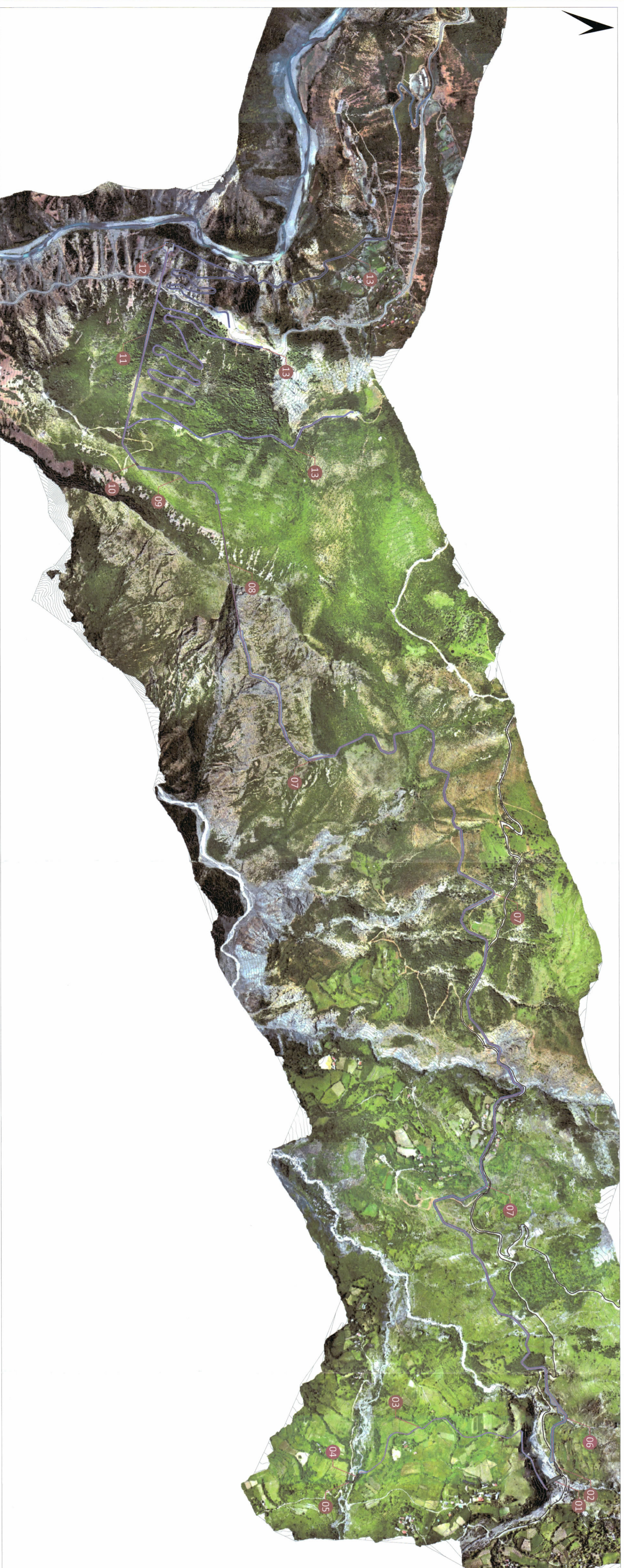
PLANI I VENDOSIES SE SHTRUKTURES HEC - GRABOVA 1