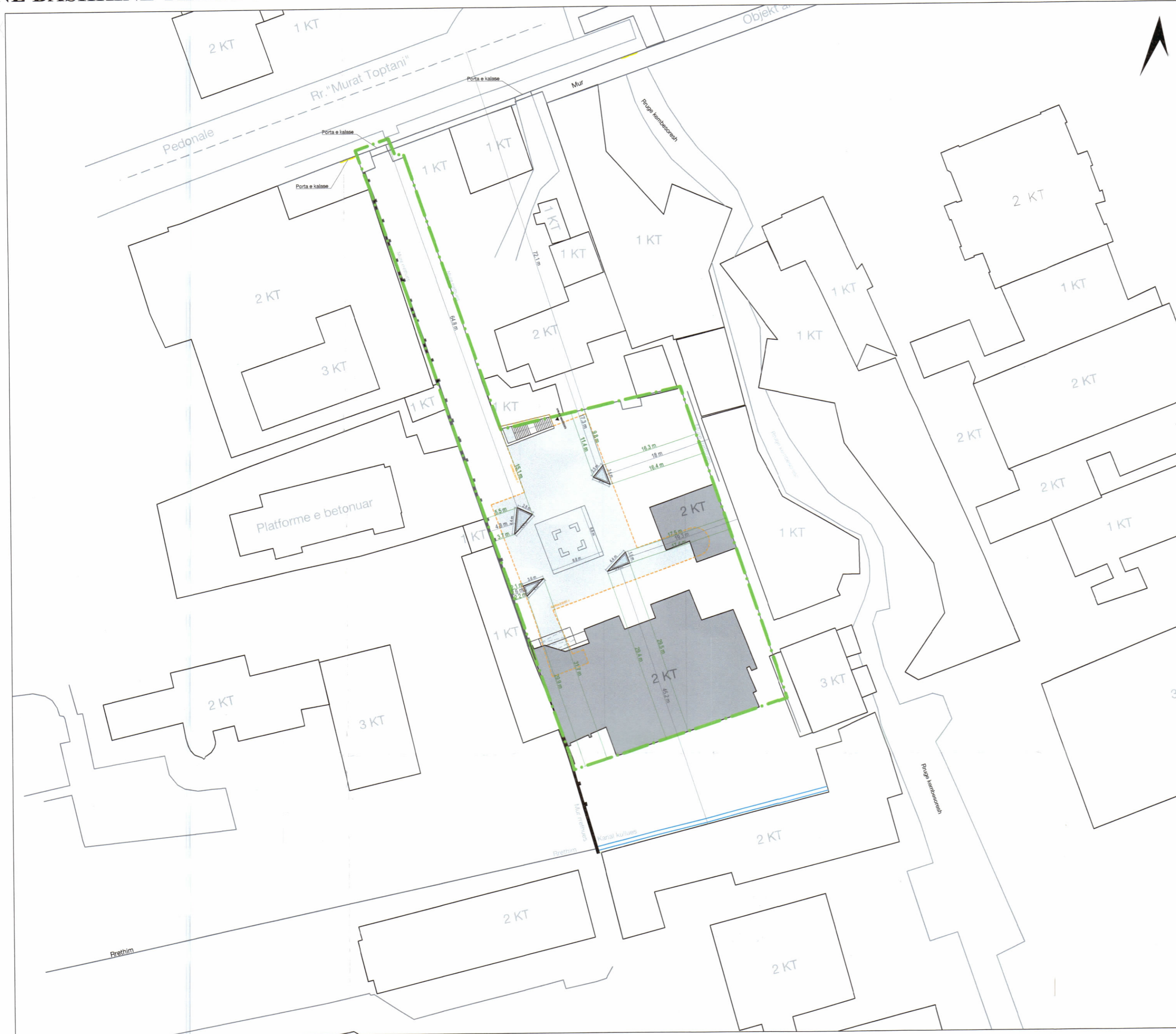
PLANI I VENDOSJES SË STRUKTURËS SHK. 1:500