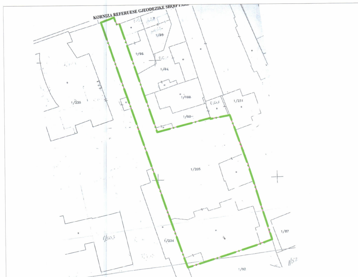
POZICIONI KADASTRAL SHK. 1:750