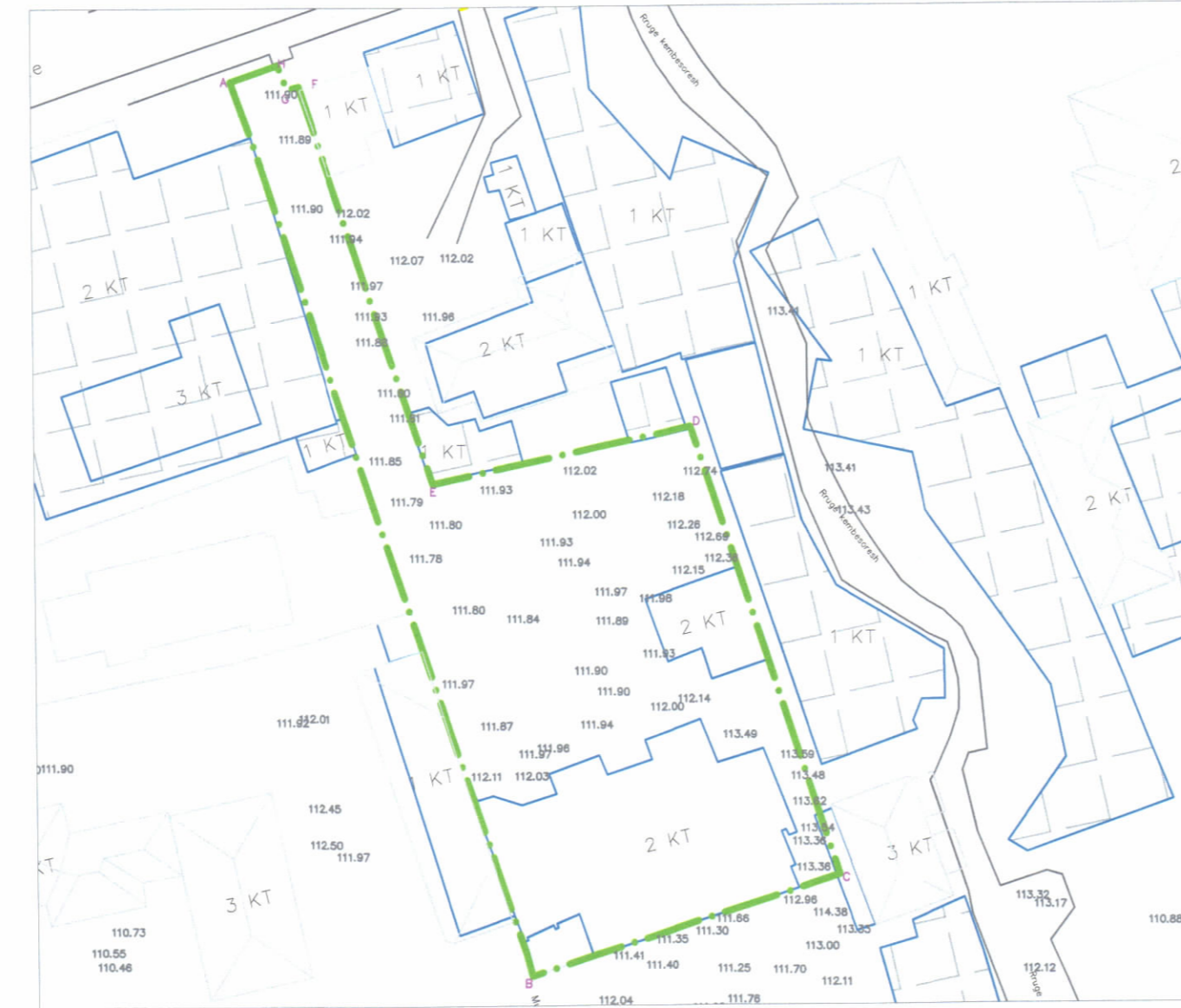
HARTA TOPOGRAFIKE SHK. 1:750