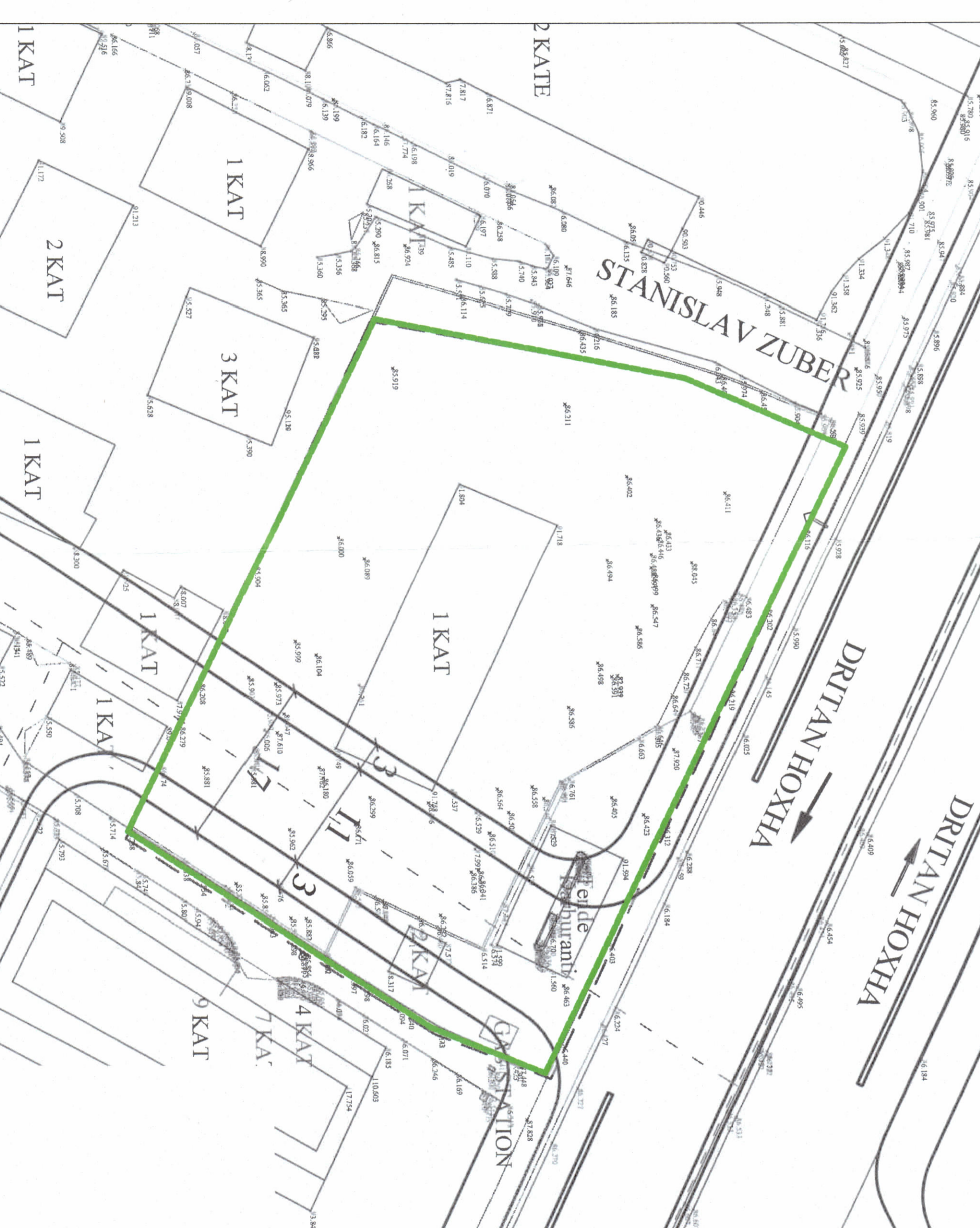
HARTA TOPOGRAFIKE - SHKALLA 1:250