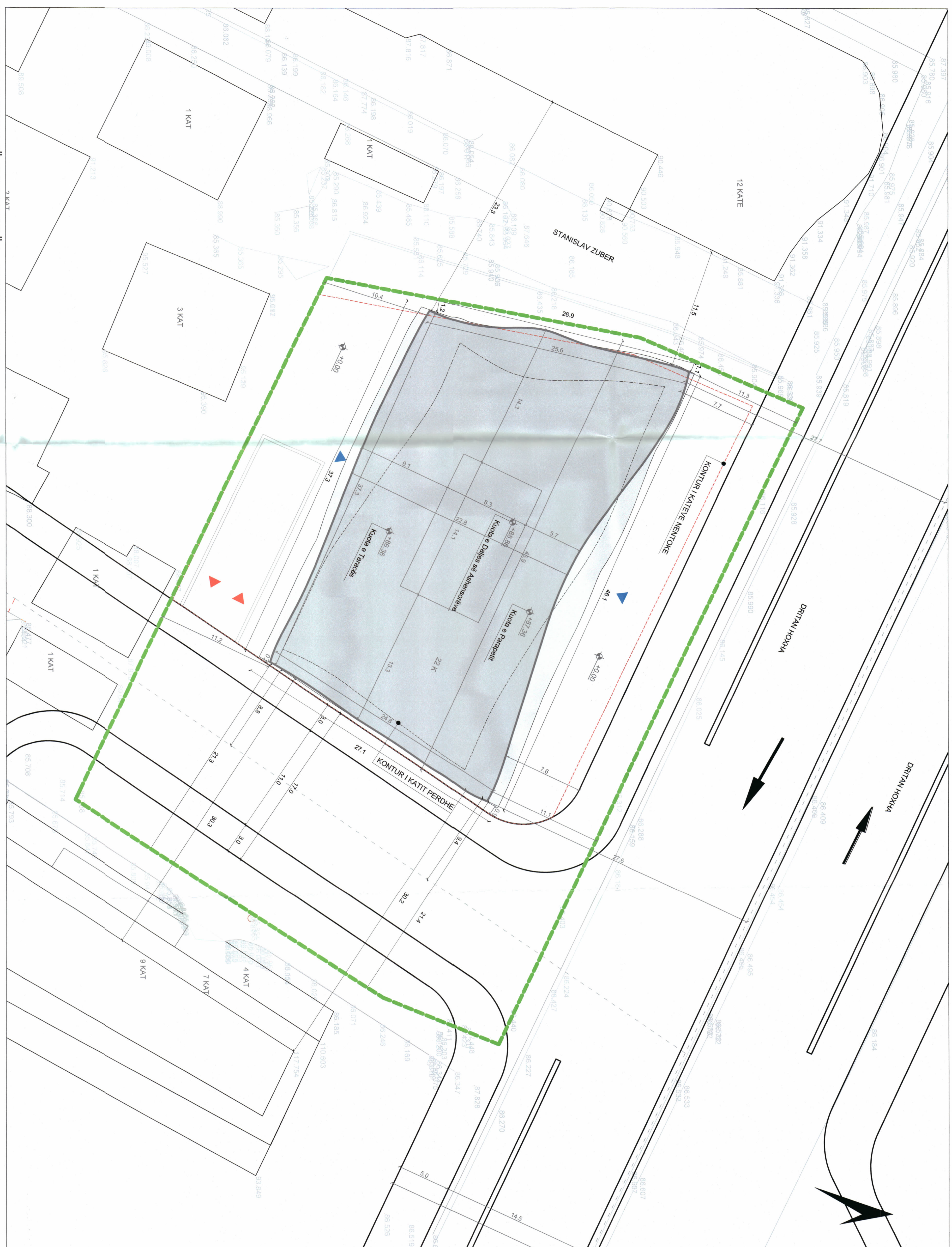
PLANI I VENDOSJES SË STRUKTURËS - SHKALLA 1:150