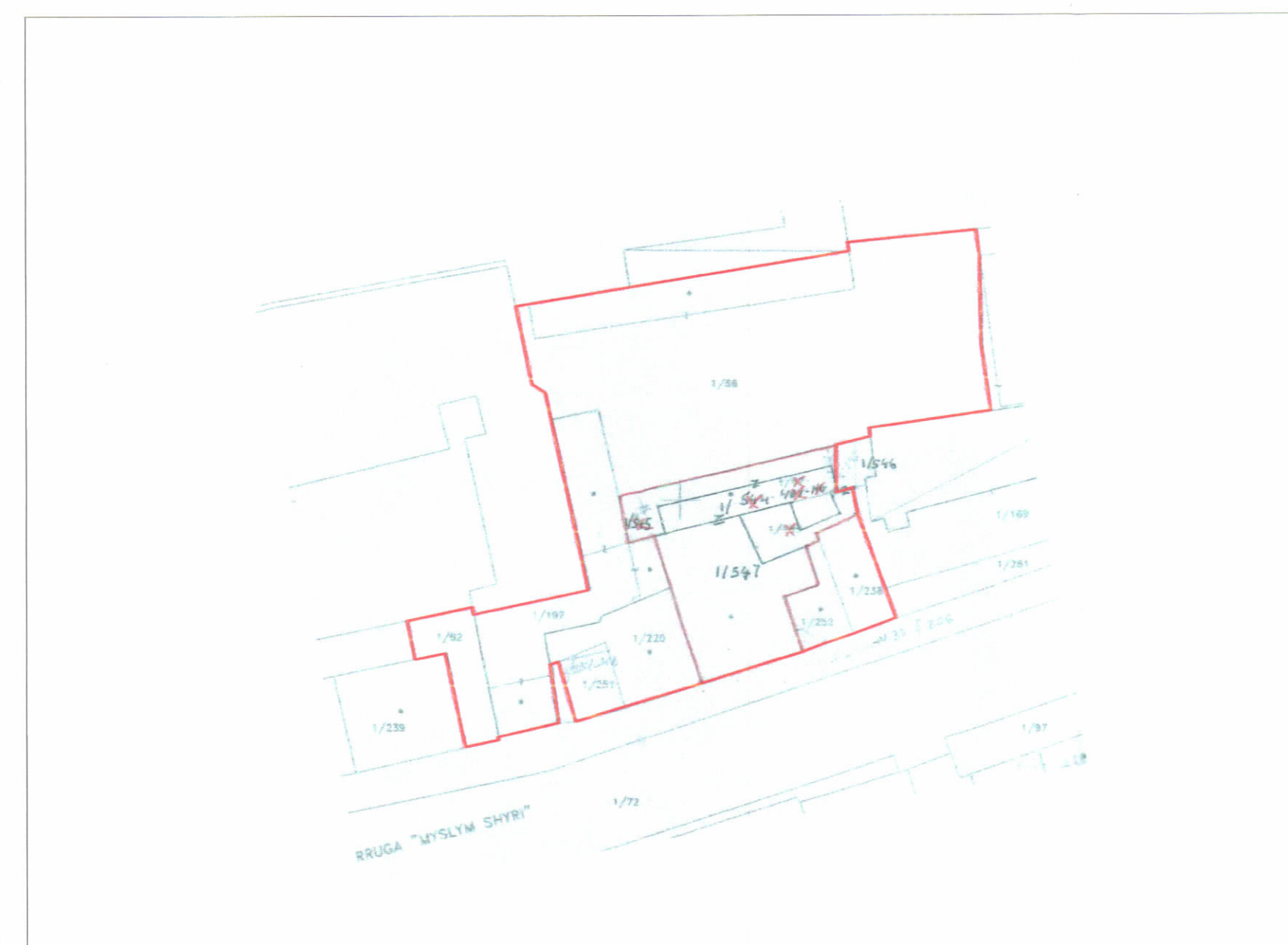
POZICIONI KADASTRAL SHK. 1:500