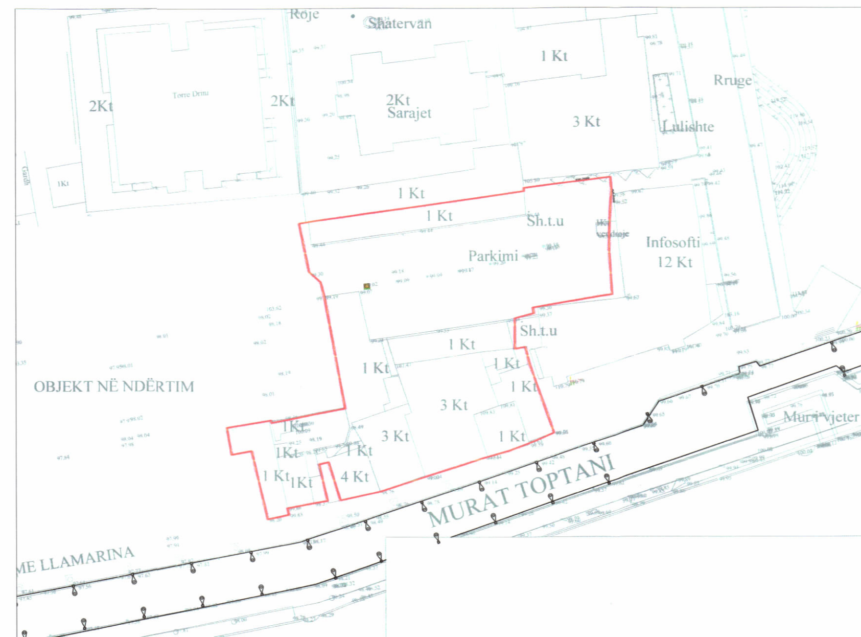
HARTA TOPOGRAFIKE SHK. 1:500