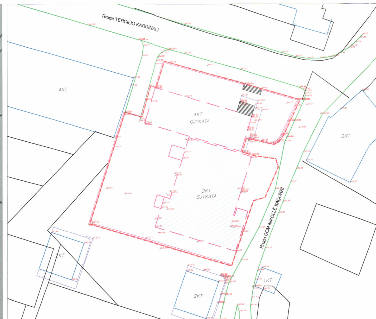
HARTA TOPOGRAFIKE SHK. 1:500