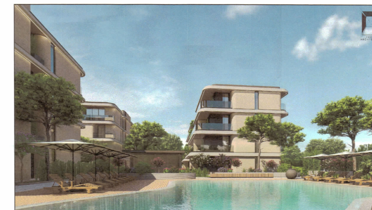
PAMJE 3 DIMENSIONALE