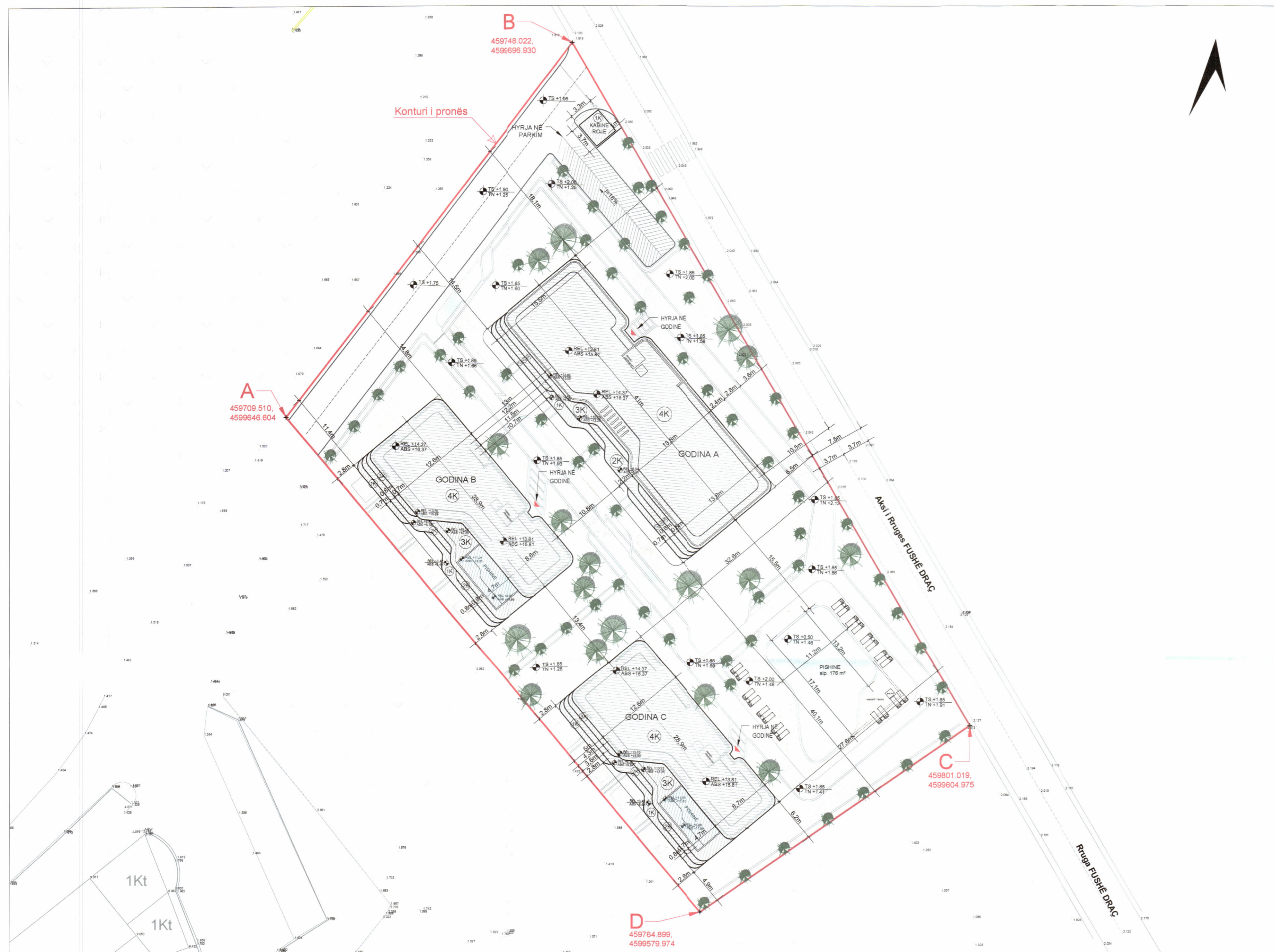
PLANI I VENDOSJES SË STRUKTURËS SHK. 1:350