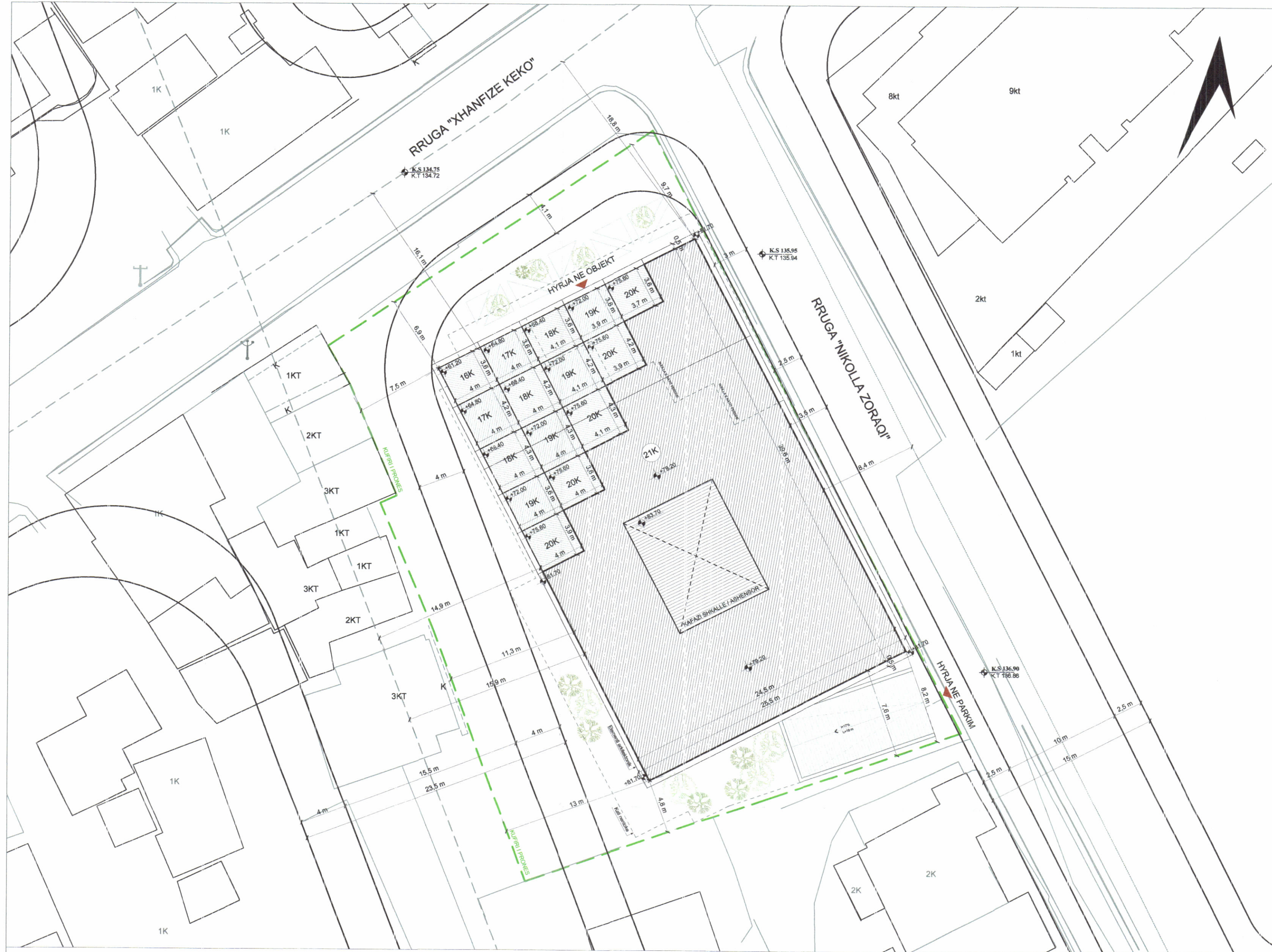
PLANI I VENDOSJES SË STRUKTURËS SHK. 1:250