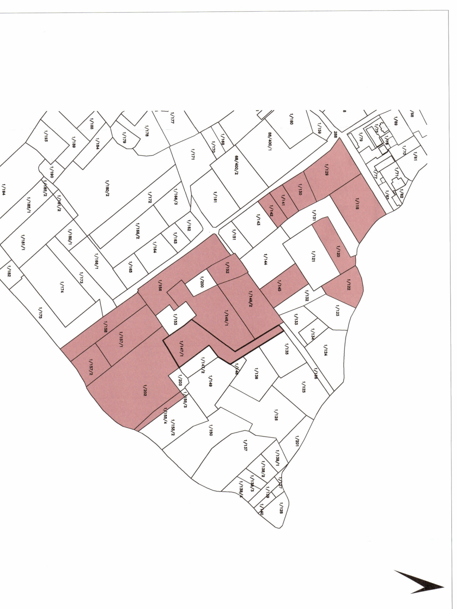
POZICIONI KADASTRAL SHK. 1:2000