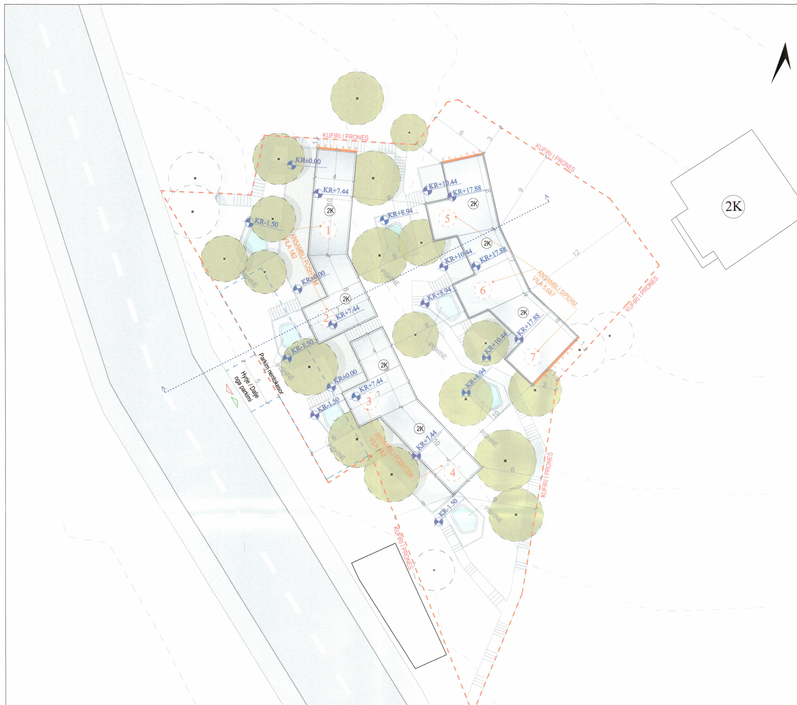
PLANI I VENDOSJES SË STRUKTURËS SHK. 1:200