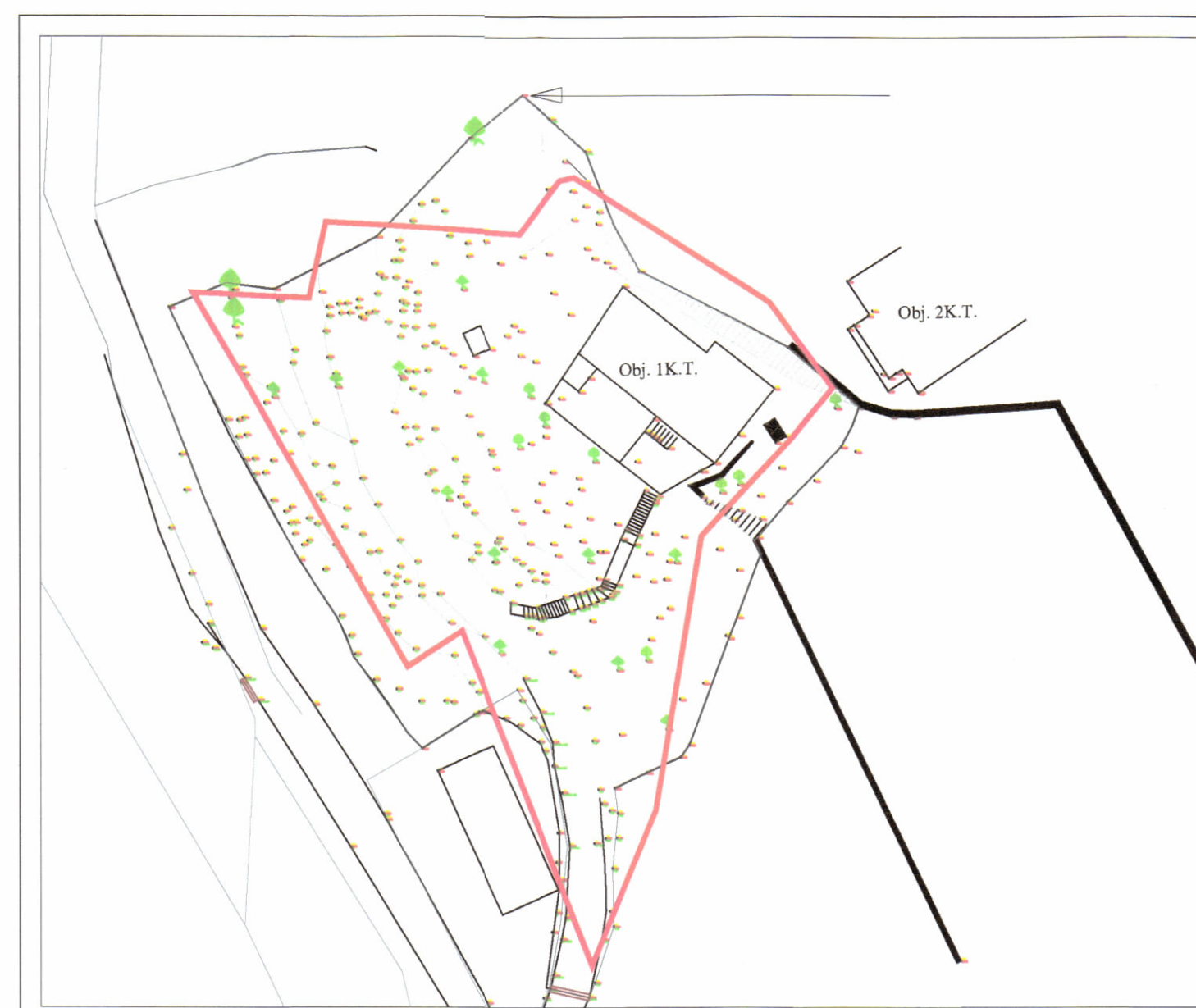
HARTA TOPOGRAFIKE SHK. 1:500