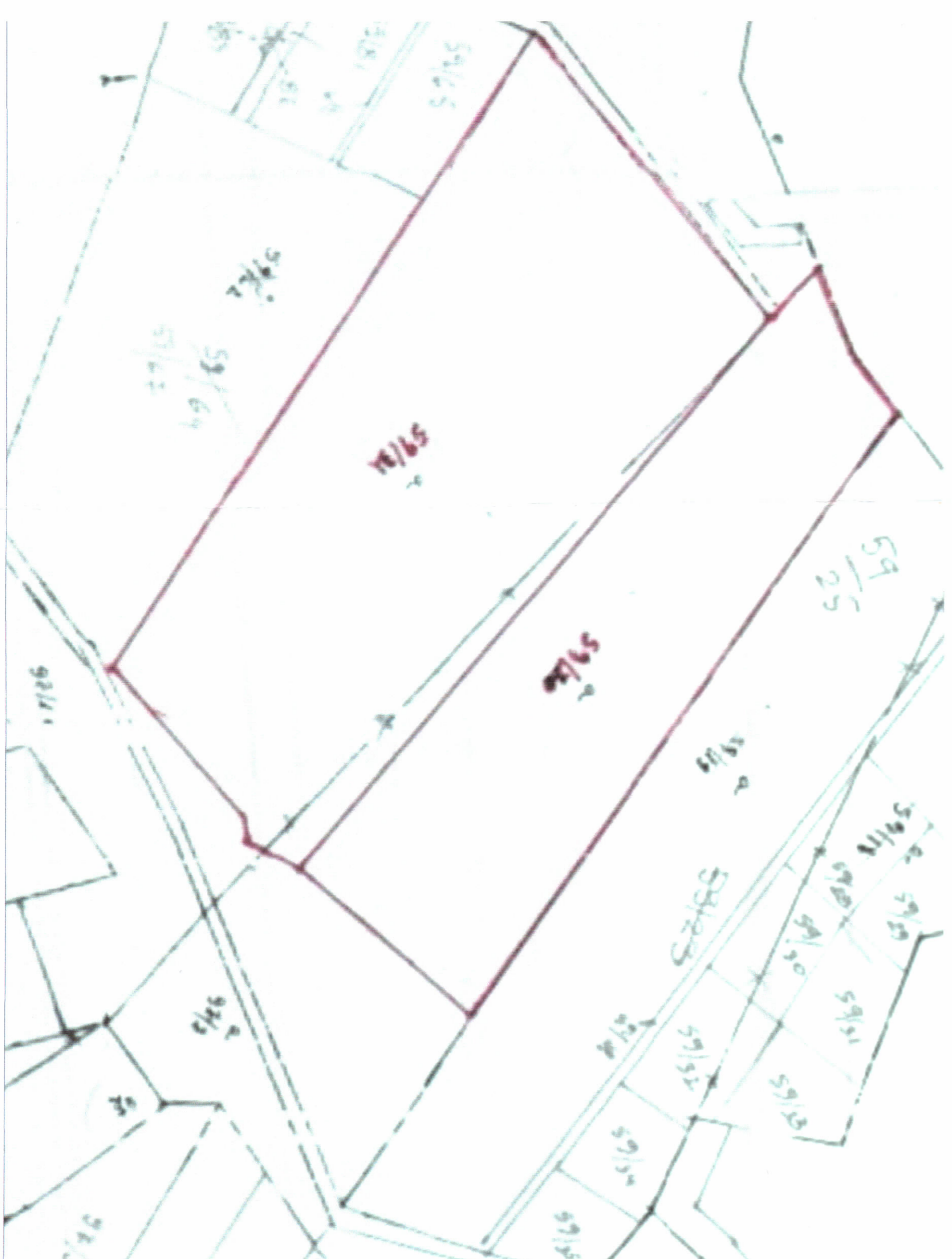
POZICIONI KADASTRAL SHK. 1:1500