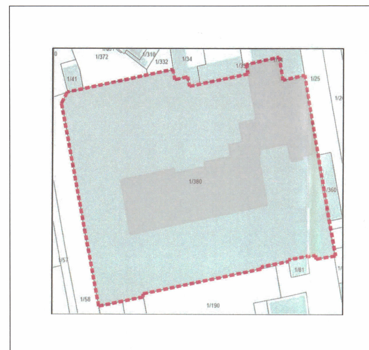
POZICIONI KADASTRAL SHK. 1:750