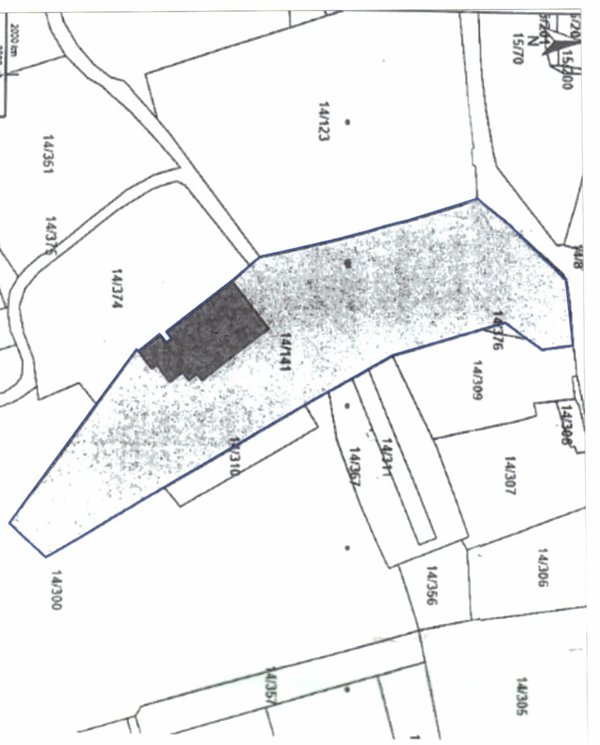
POZICIONI KADASTRAL SHK. 1:1000