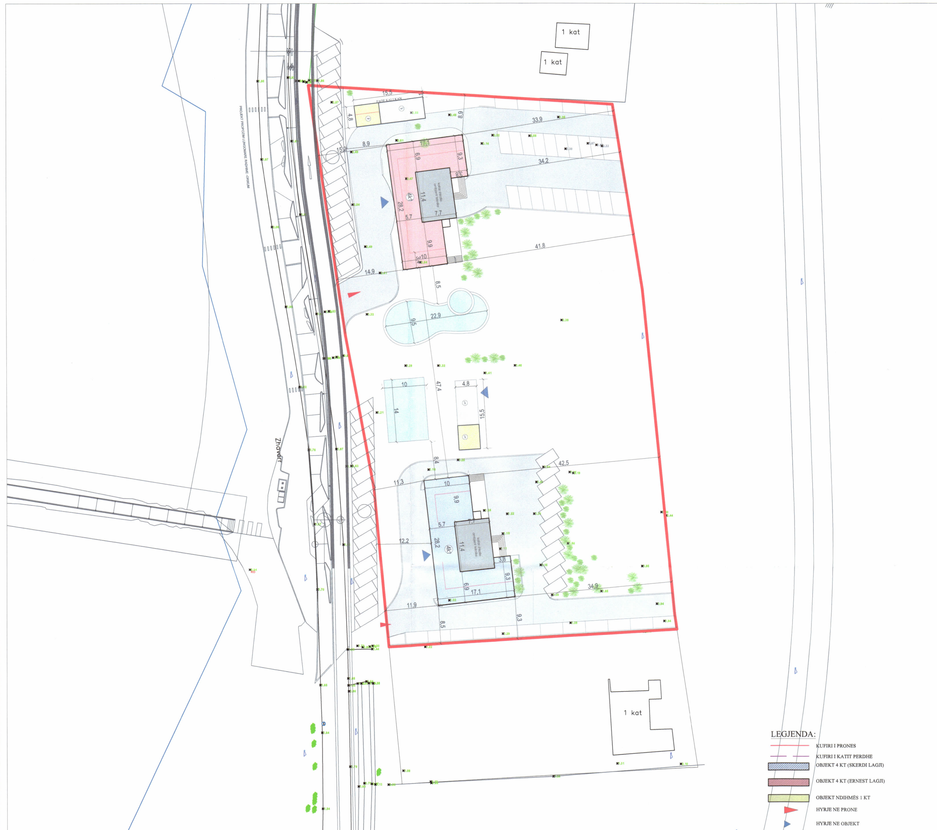
PLANI I VENDOSJES SË STRUKTURËS SHK. 1: 500