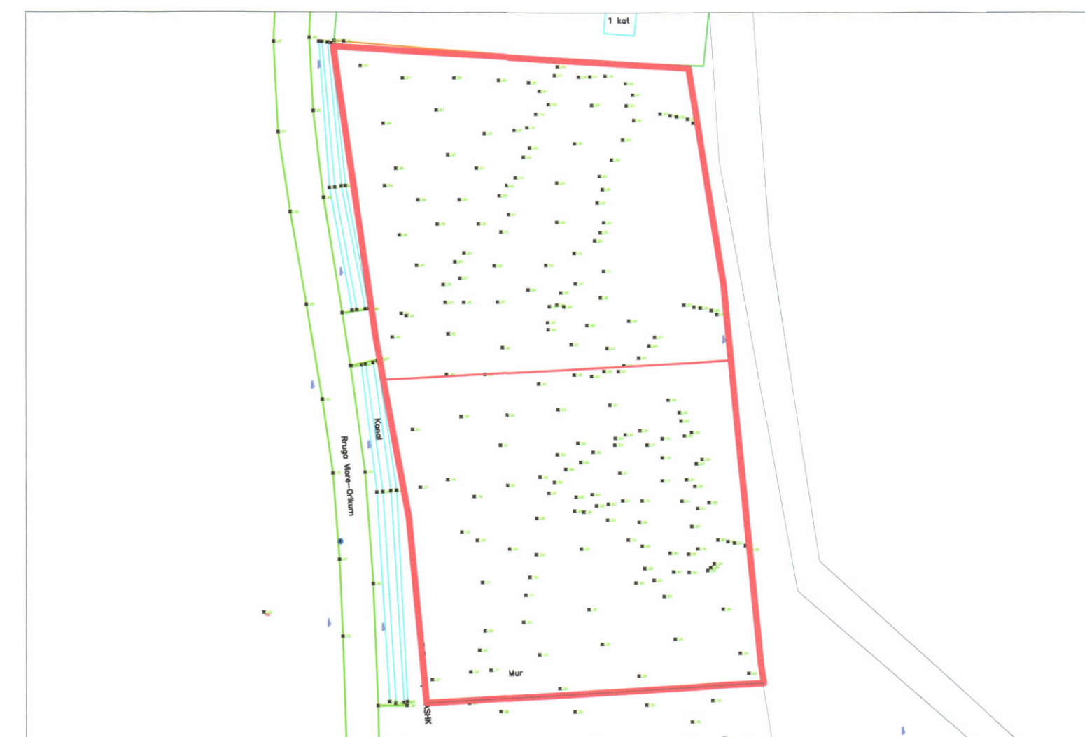
HARTA TOPOGRAFIKE SHK. 1:1000