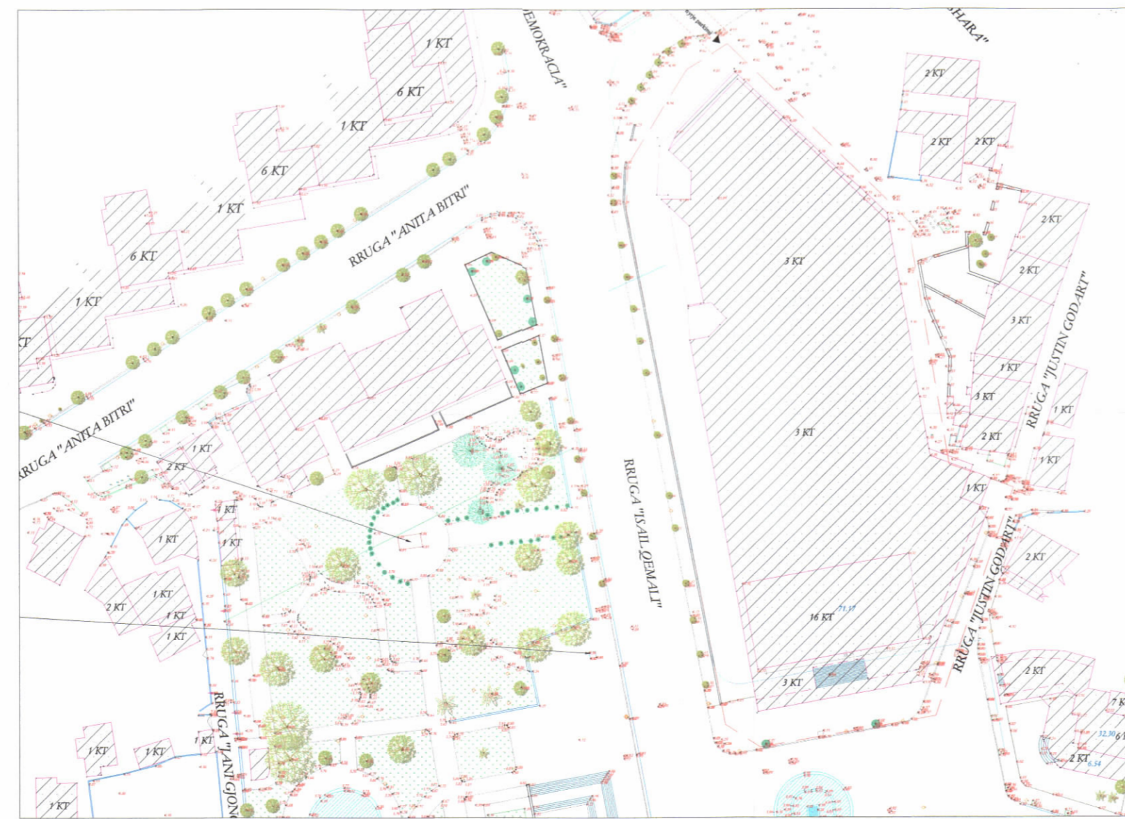
HARTA TOPOGRAFIKE SHK. 1:1200