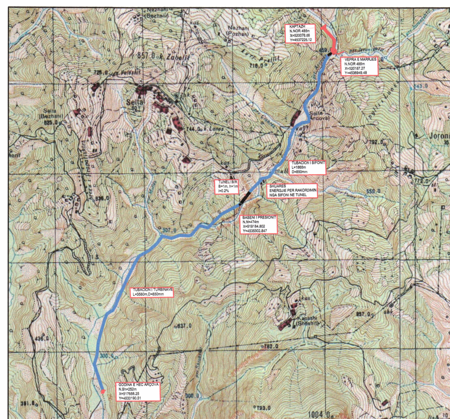
HARTA TOPOGRAFIKE SHK. 1:15000