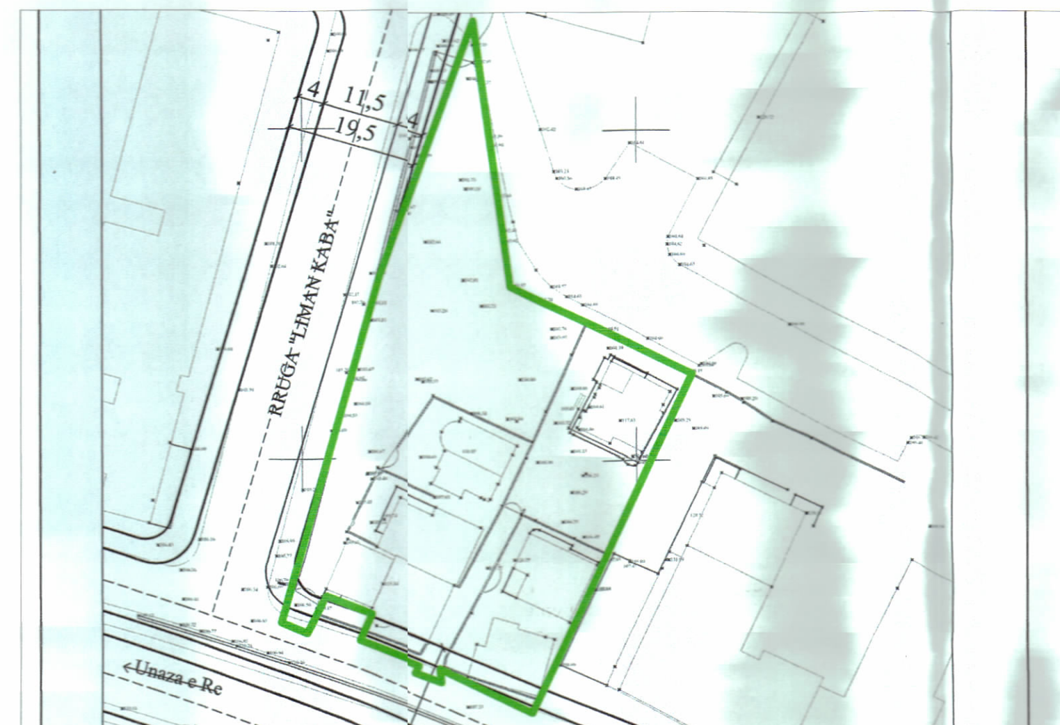
HARTA TOPOGRAFIKE SHK. 1:1000