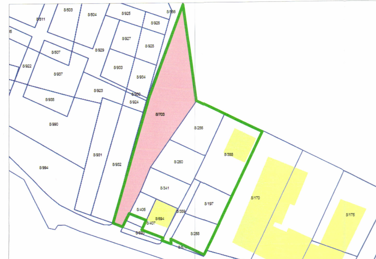
POZICIONI KADASTRAL SHK. 1:1000