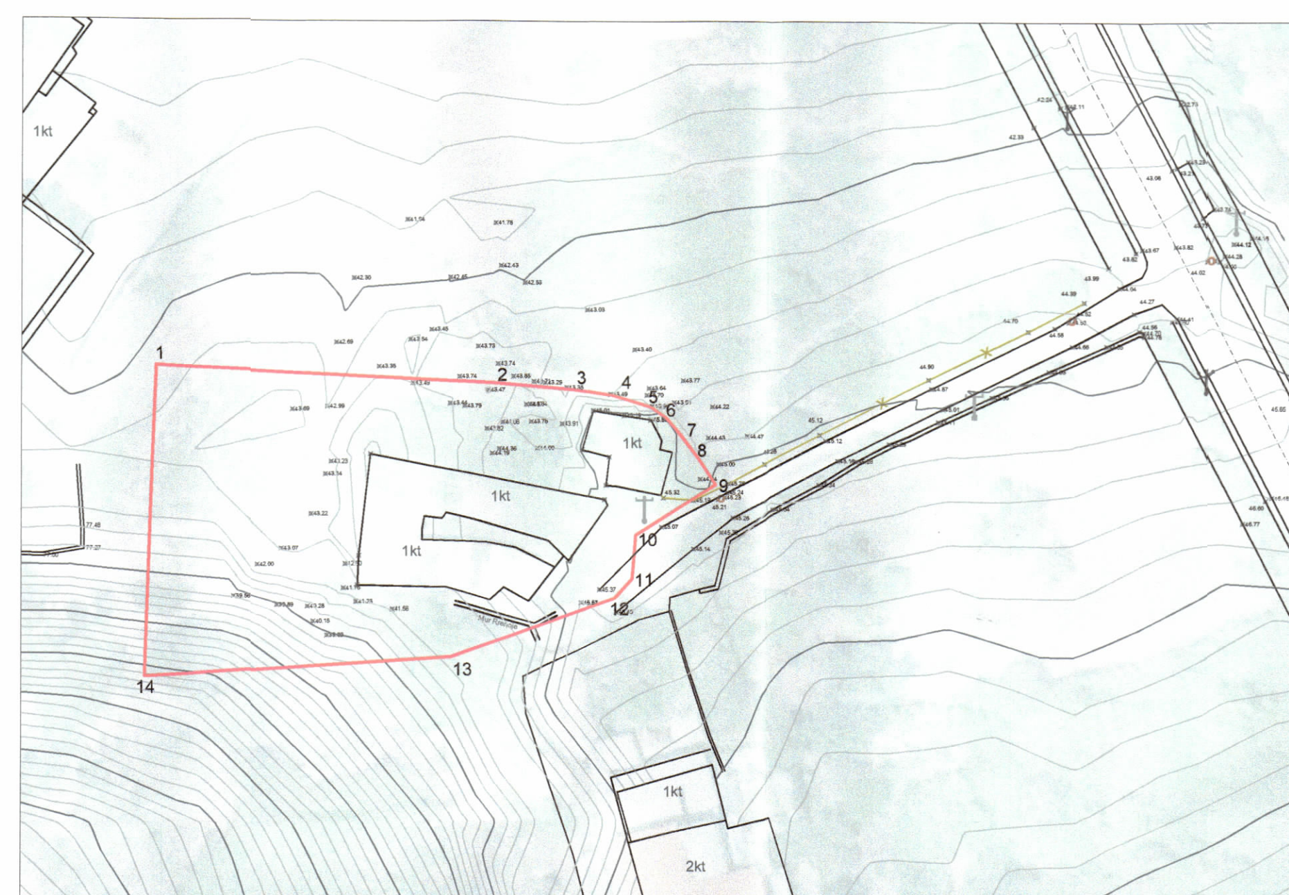
POZICIONI TOPOGRAFIK SHK. 1:500