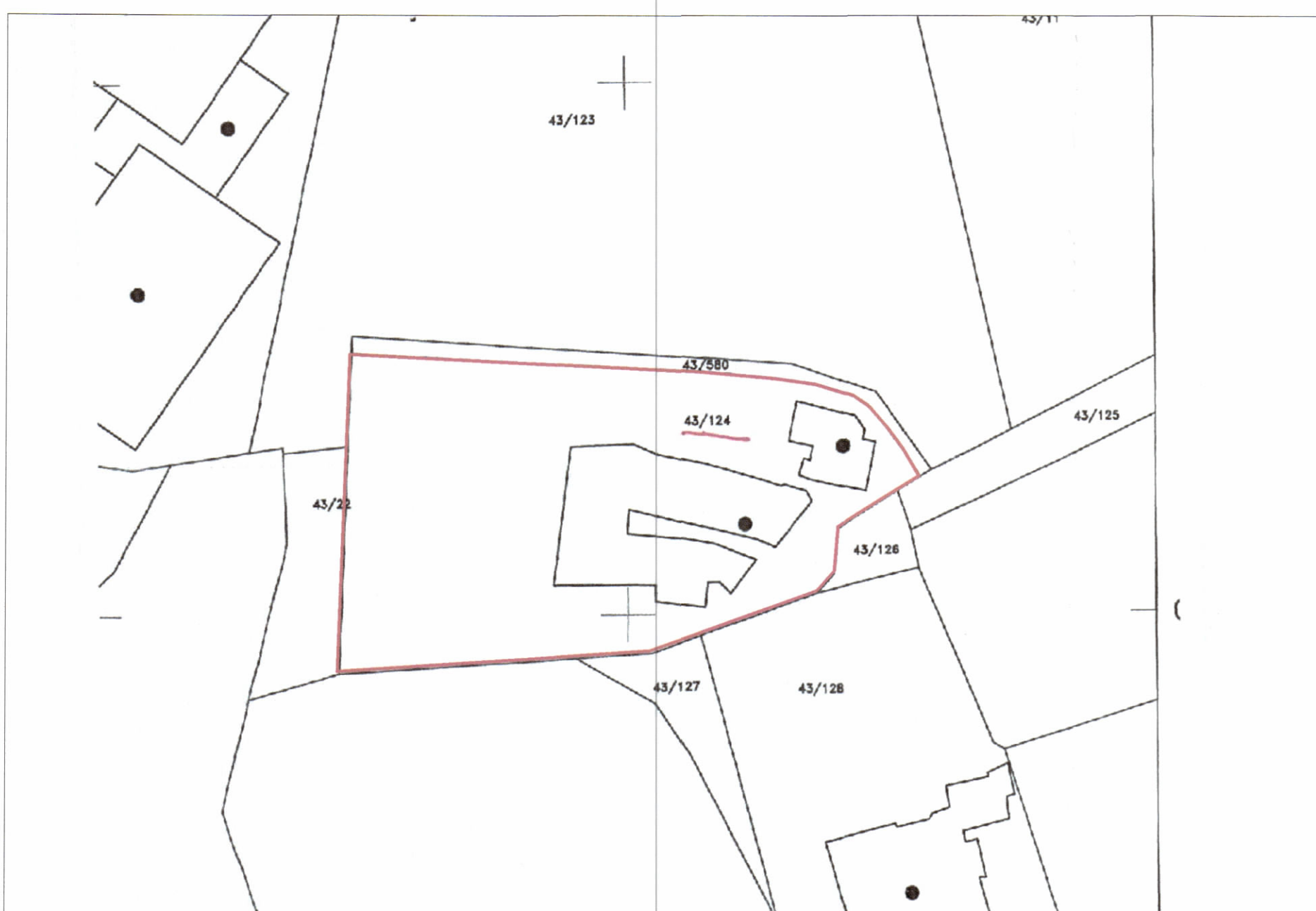
POZICIONI KADASTRAL SHK. 1:500