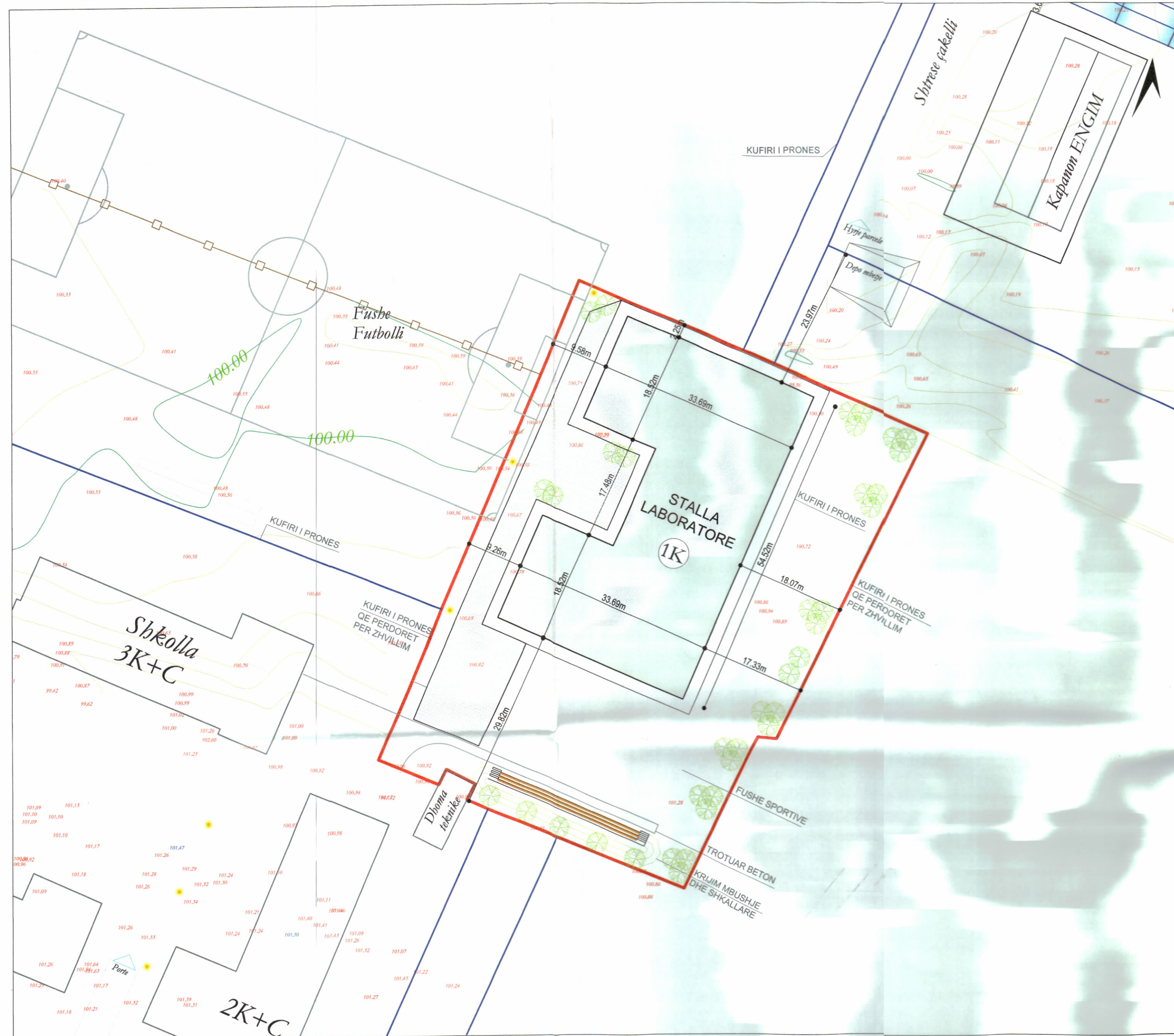
PLANI I VENDOSJES SË STRUKTURËS SHK. 1:500