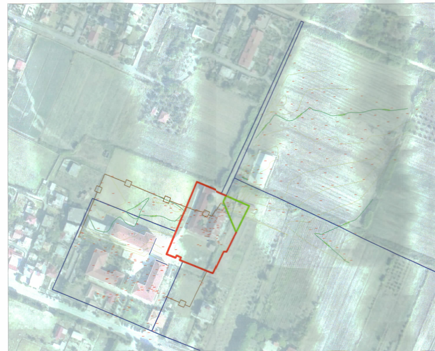
HARTA TOPOGRAFIKE SHK. 1:2500