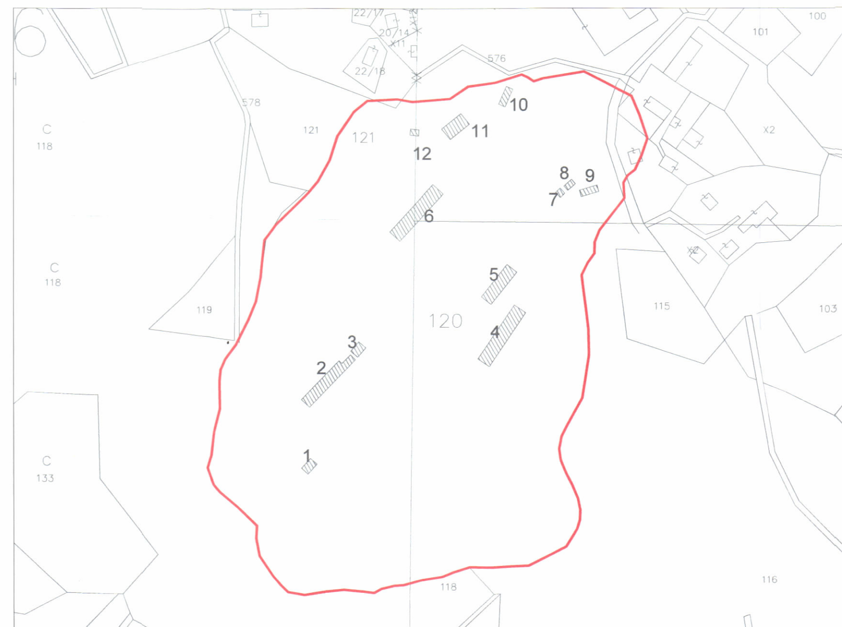
HARTA TOPOGRAFIKE SHK. 1:2000