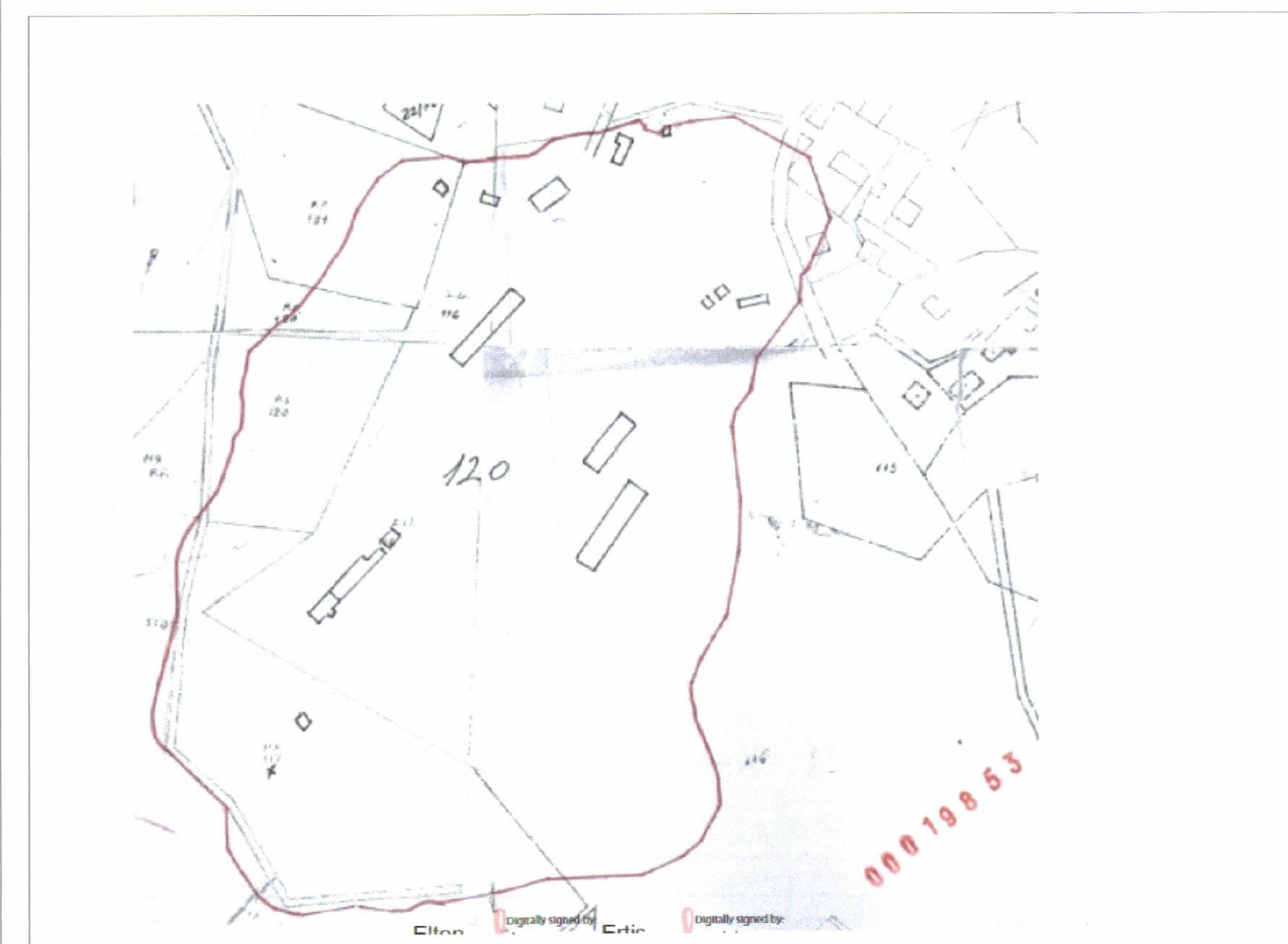
POZICIONI KADASTRAL SHK. 1:2000