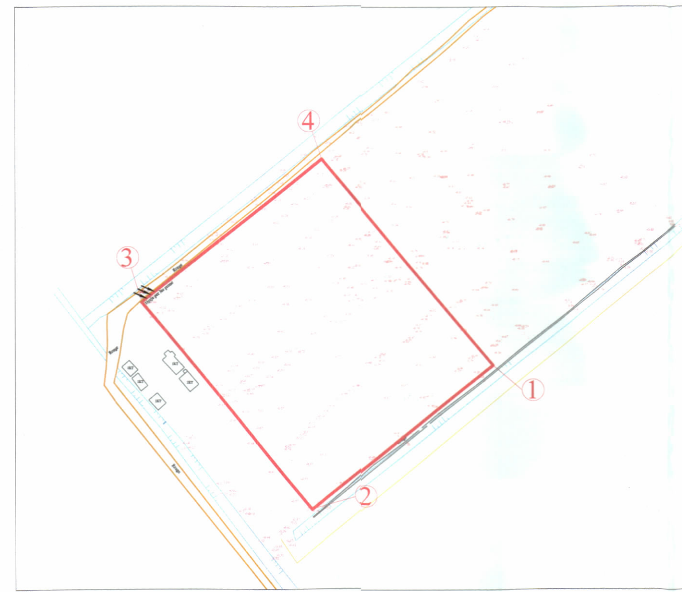
HARTA TOPOGRAFIKE SHK. 1:250