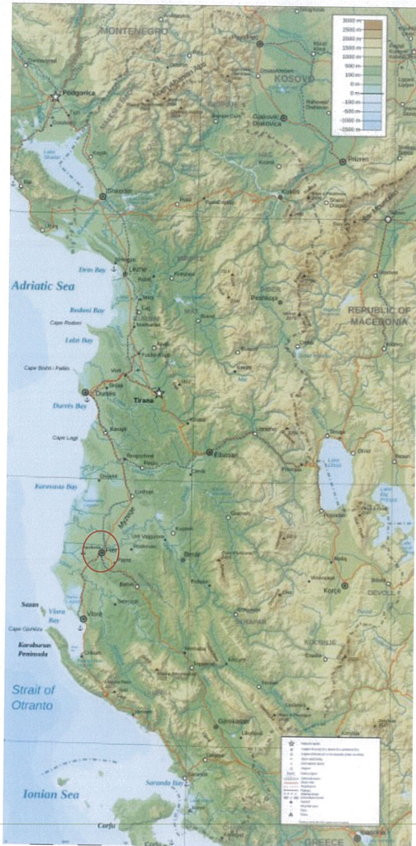
Figura 2 – Vendndodhja e zhvillimit