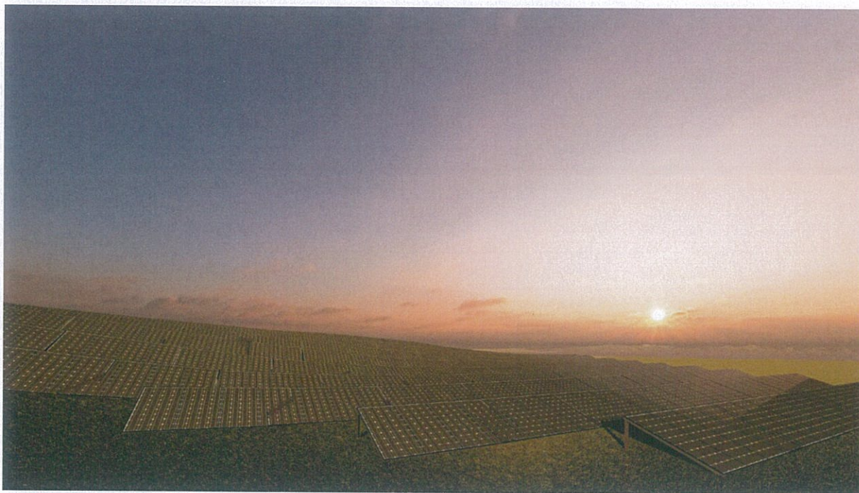
Figura 5-Impianti Fotovoltaik

Modulet fotovoltaike do të montohen në një strukturë metalike e cila është e inkastruar në tokë. Terreni ka relief fushor me lartësi të vogël mbi nivelin e detit duke e bërë parcelën të përshtatshme për montimin e paneleve fotovoltaike.