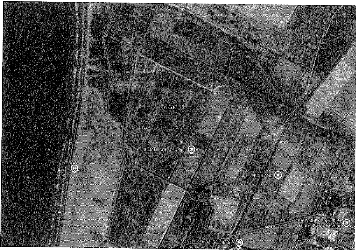
Figura 1 – Pozicionimi gjeografik i zones

Sheshi i ndërtimit ka një sipërfaqe totale prej rreth 18650m 2 . Përvec impiantit fotovoltaik ekzistues rreth e përqark sheshit nuk ka objektet të tjera. Kjo zonë vitet e fundit është studiuar shumë në lidhje me mundësinë e ndërtimit të impianteve fotovoltaike për prodhim energjie elektrike nga energjia diellore.