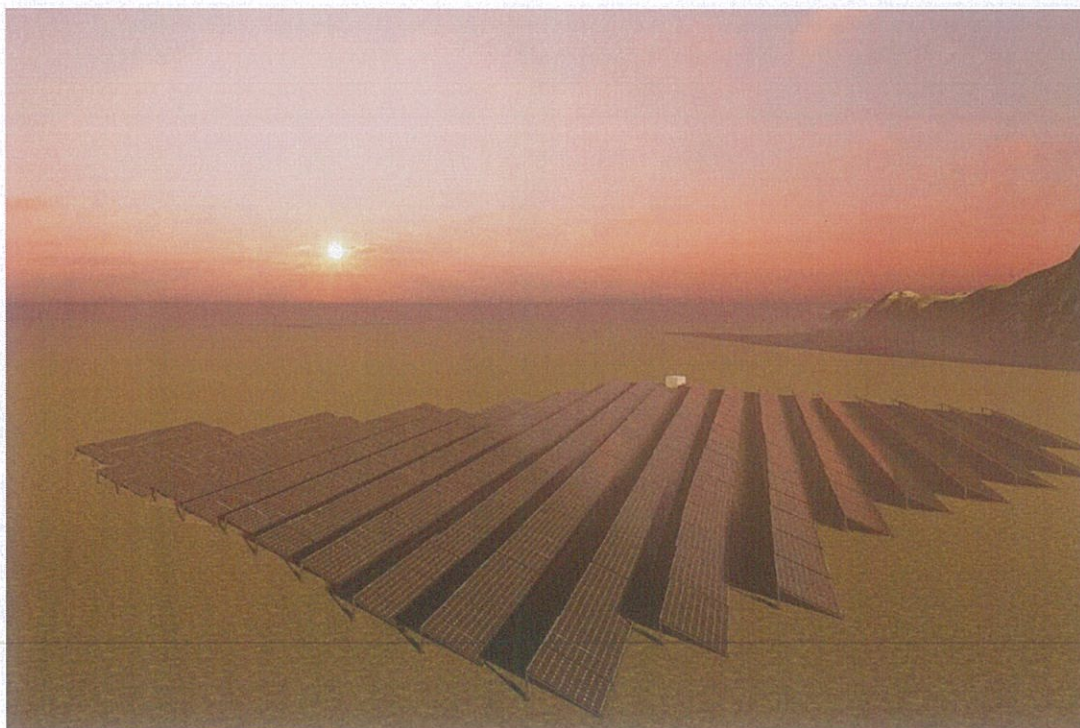
Figura 5-Impianti Fotovoltaik

Modulet fotovoltaike do të montohen në një strukturë metalike e cila është e inkastruar në tokë. Terreni ka reliev fushor me lartësi të vogël mbi nivelin e detit duke e bërë parcelën të përshtatshme për montimin e paneleve fotovoltaike.