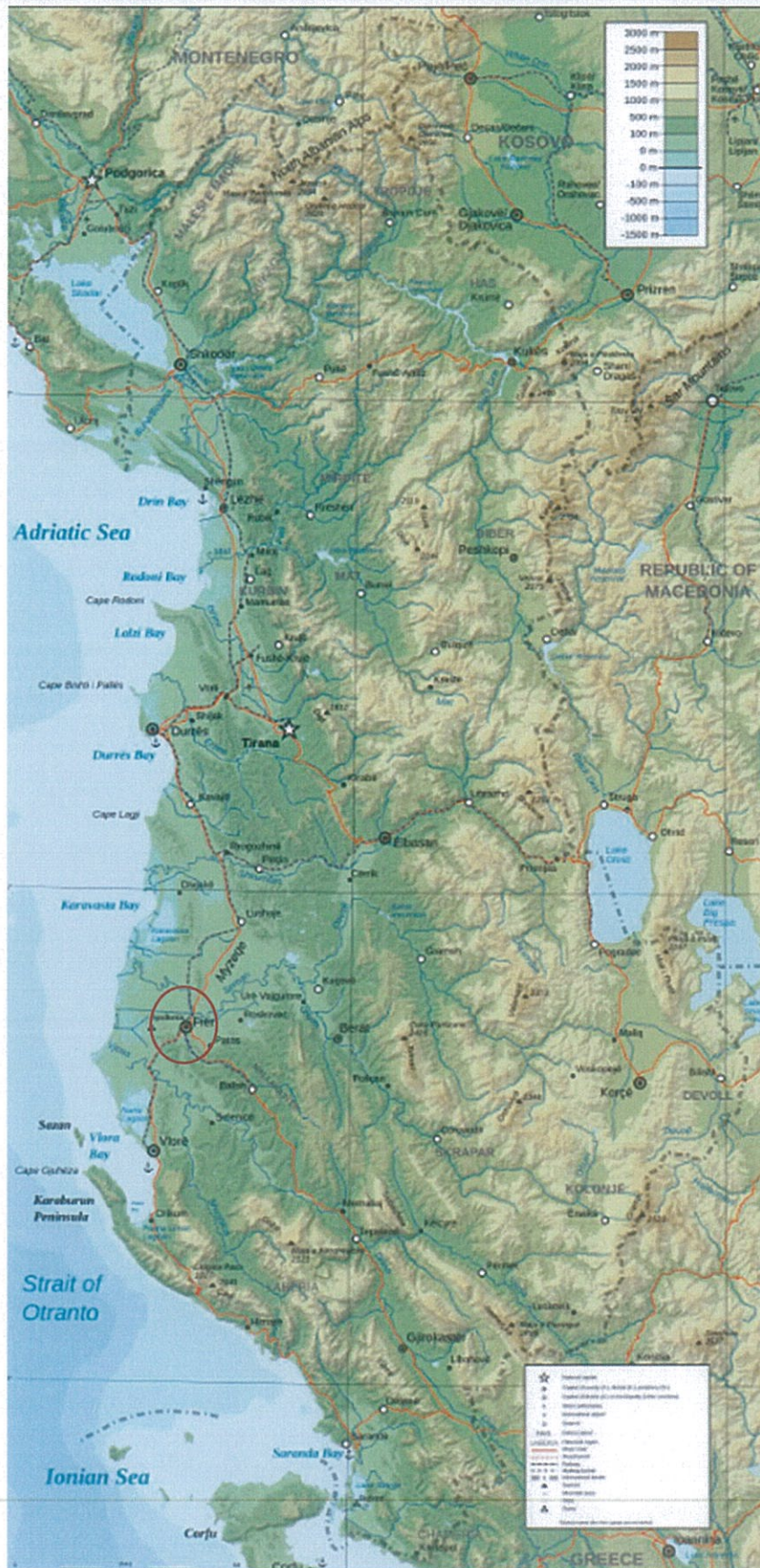
Figura 2 – Vendndodhja e zhvillimit