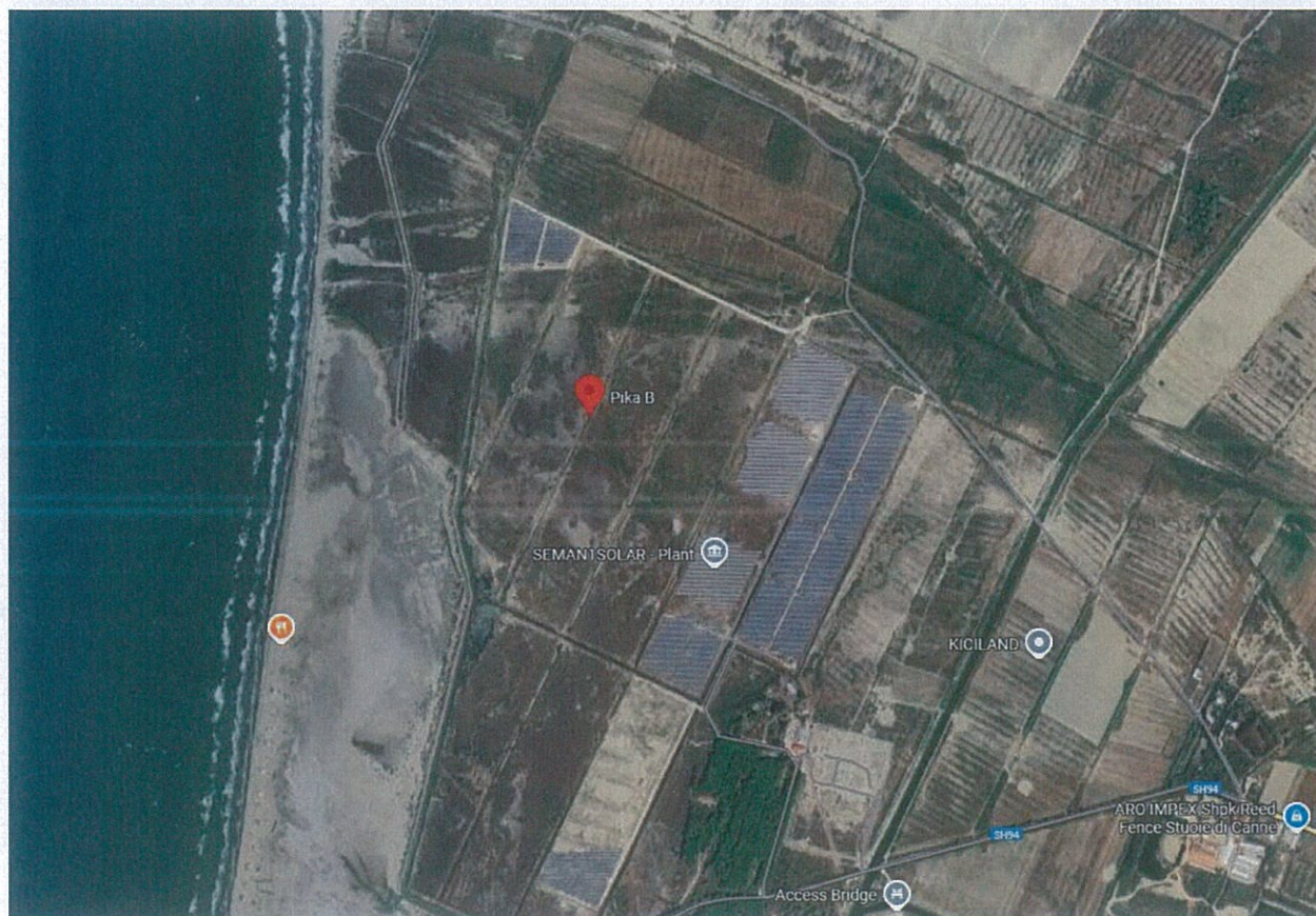
Figura 1 – Pozicionimi gjeografik i zones

Sheshi i ndërtimit ka një sipërfaqe totale prej rreth 20.000m 2 . Përveç impiantit fotovoltaik ekzistues rreth e përfaqë sheshit nuk ka objektet të tjera. Kjo zonë vitet e fundit është studiuar shumë në lidhje me mundësinë e ndërtimit të impianteve fotovoltaike për prodhim energjie elektrike nga energjia diellore.