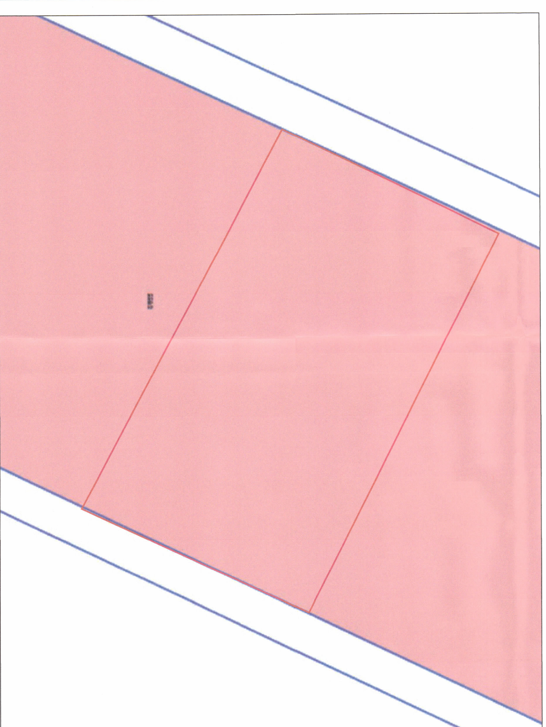
POZICIONI KADASTRAL SHK. 1:1000