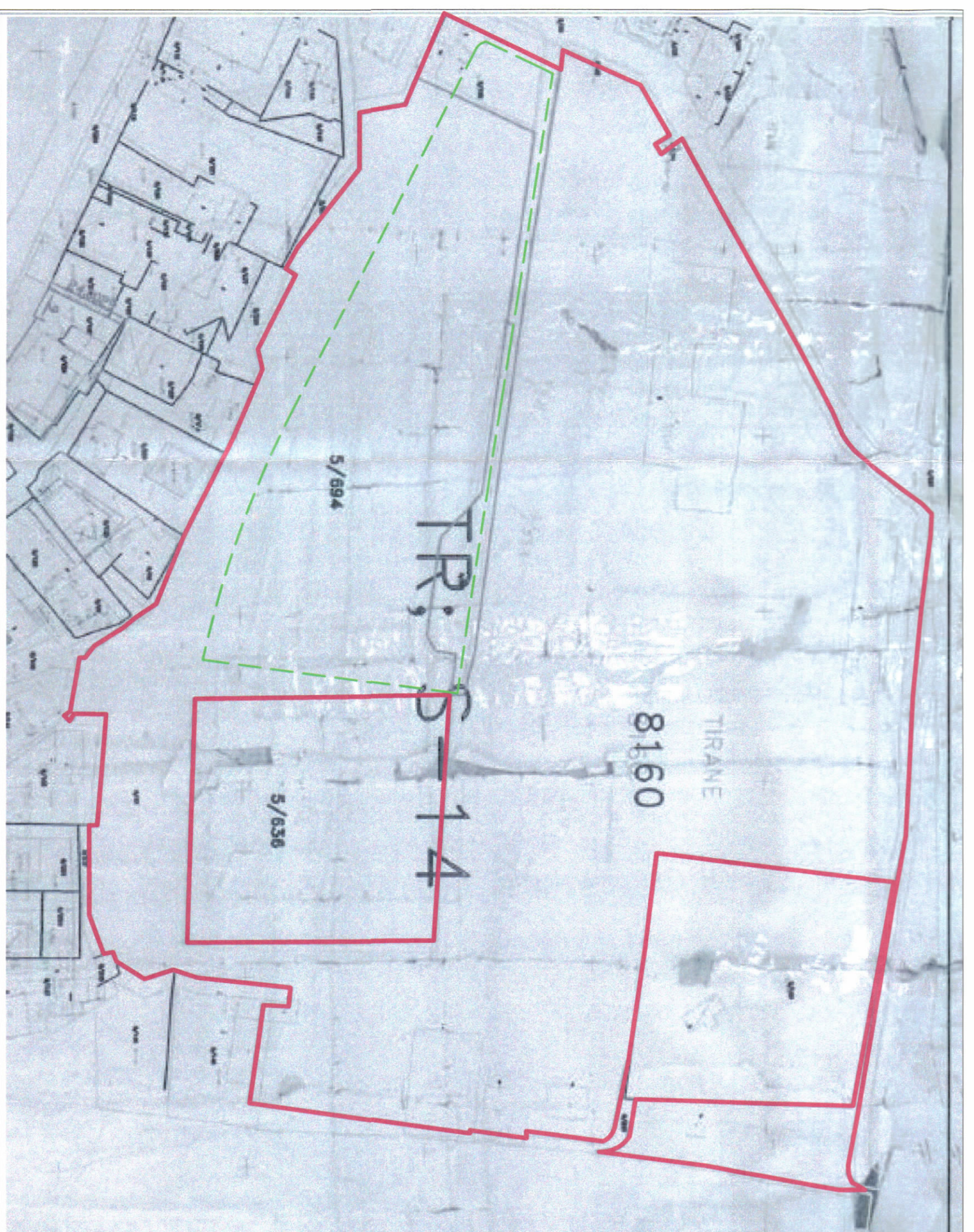
POZICIONI KADASTRAL SHK. 1: 1250