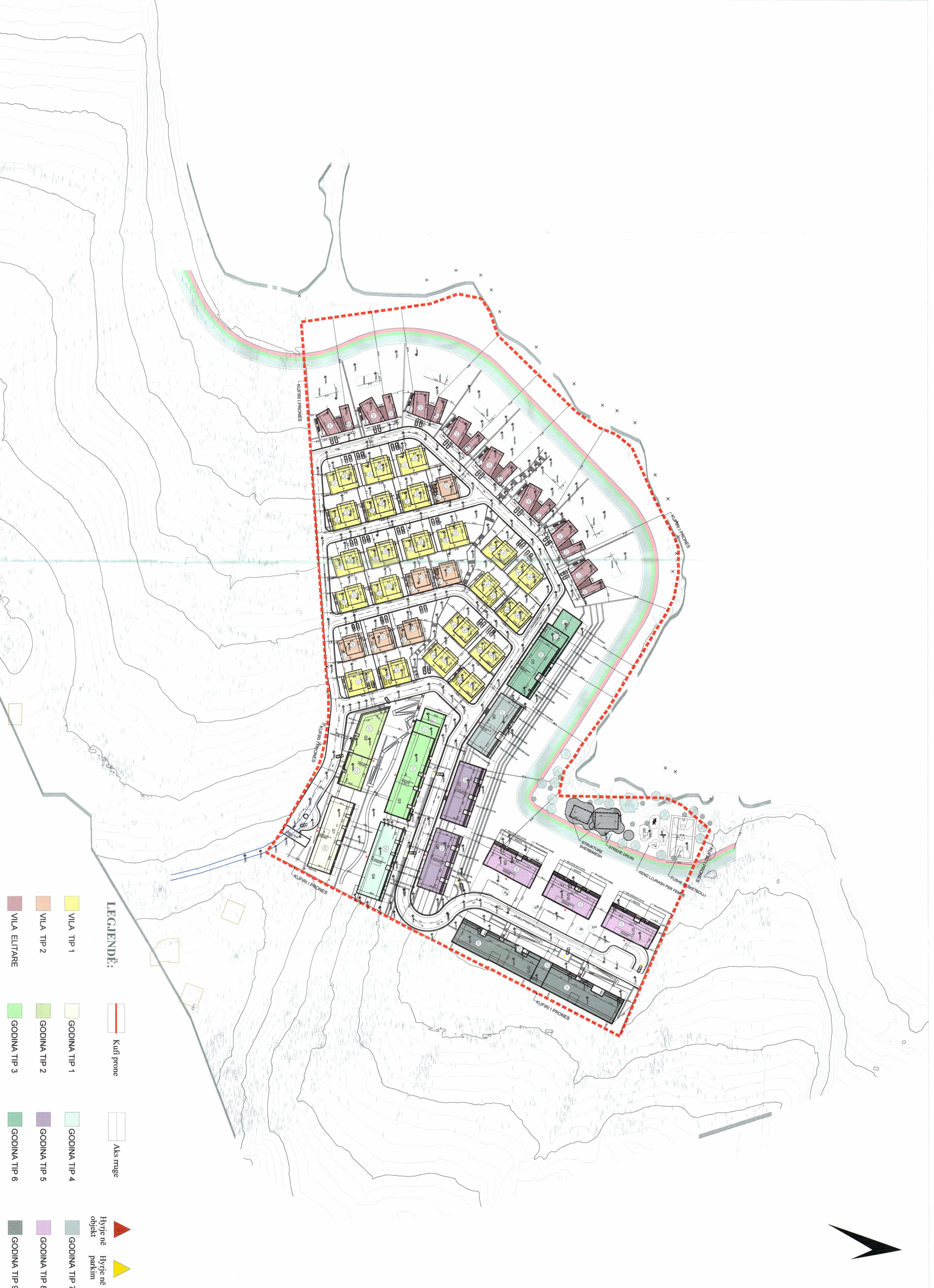
PLANI I VENDOSJES SË STRUKTURËS SHK. 1: 500