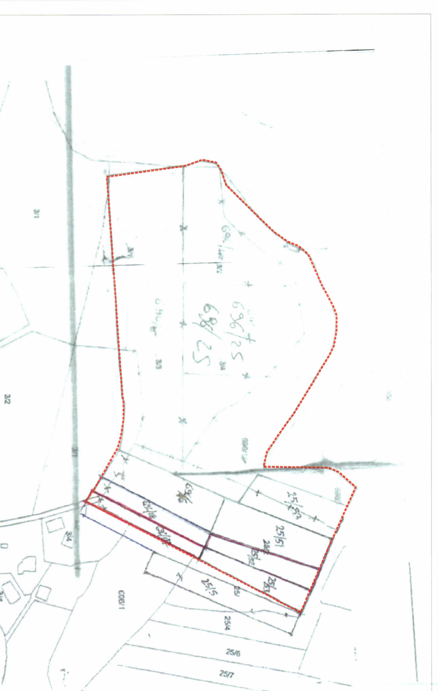
POZICIONI KADASTRAL SHK. 1:2000

Veti : 35.8 m, 3.5 m Pentdim : 47.6 m, 57.1 m Jug : 4.3 m, 7.2 m Lindje : 4 m, 4.1 m