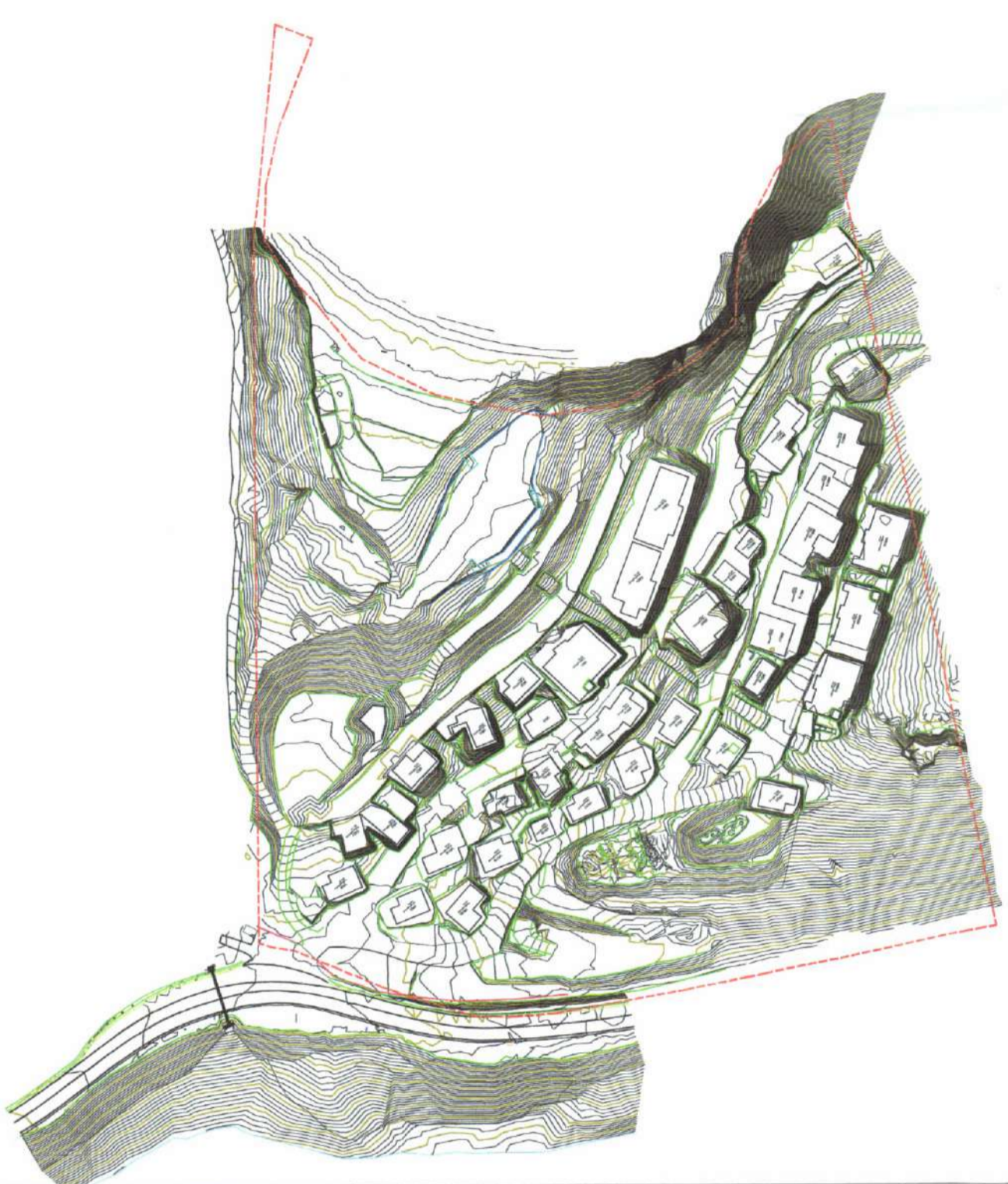
HARTA TOPOGRAFIKE SHK. 1:2000