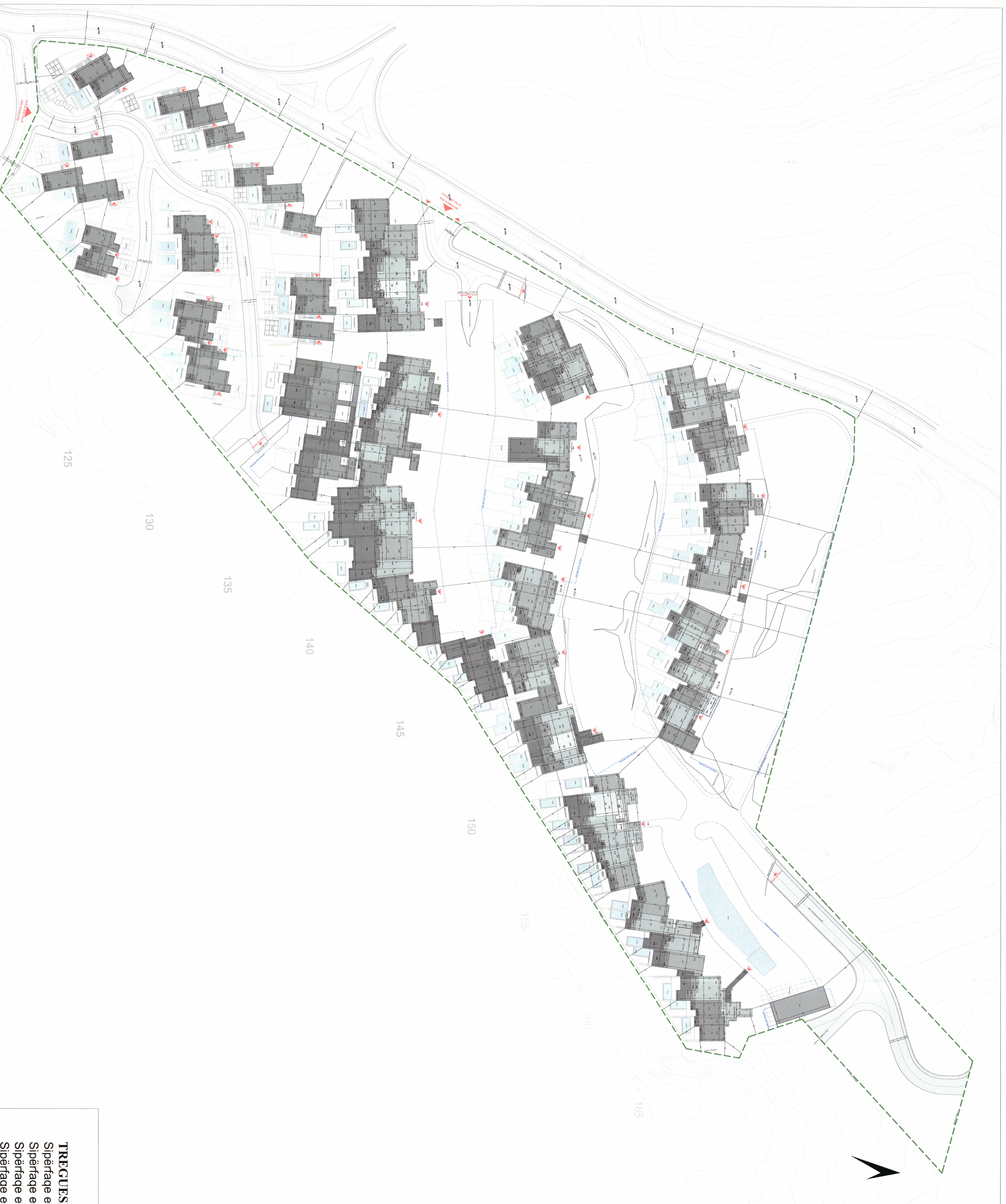
PLANI I VENDOSJES SË STRUKTURËS SHK. 1:650