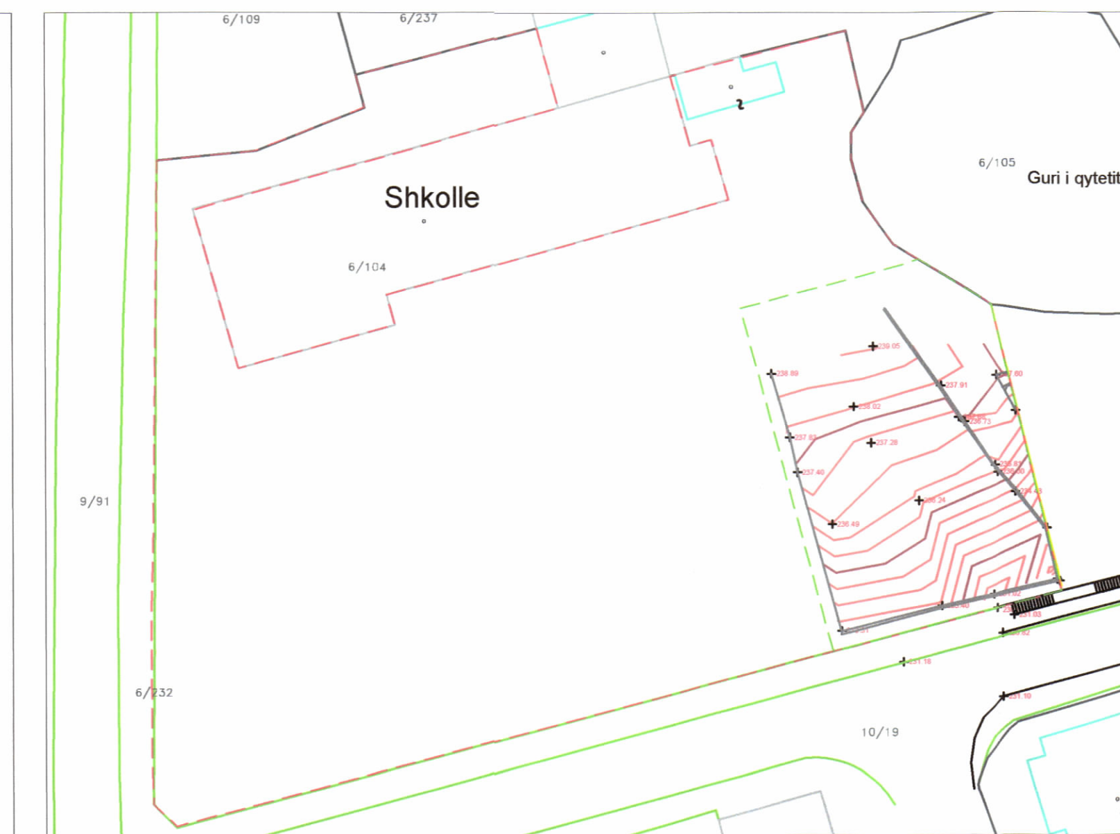
HARTA TOPOGRAFIKE SHK. 1:500

REPUBLICA E SHQIPËRISË KËSHILLI KOMBËTAR I TERRITORIT