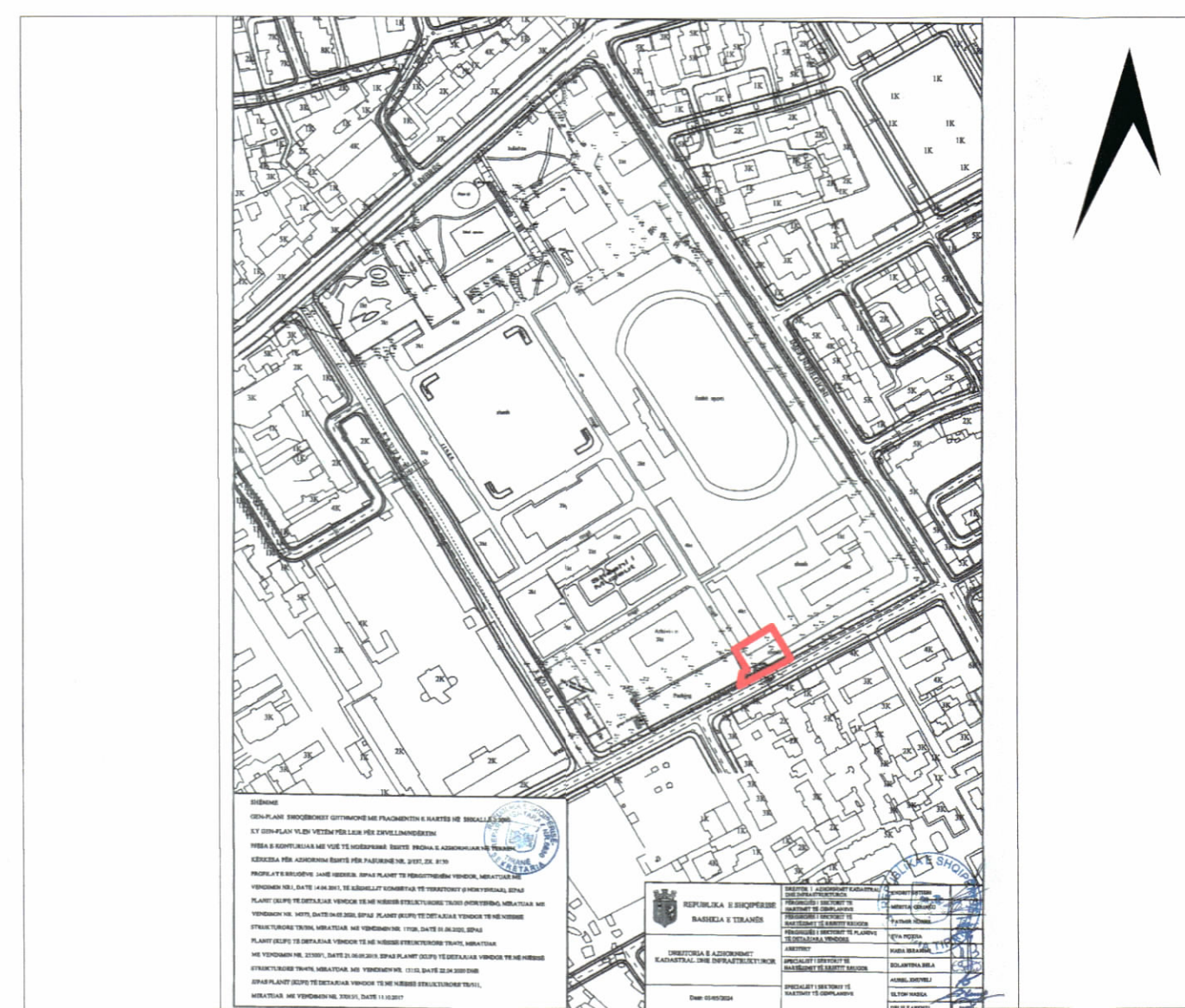
HARTA TOPOGRAFIKE SHK. 1:2500