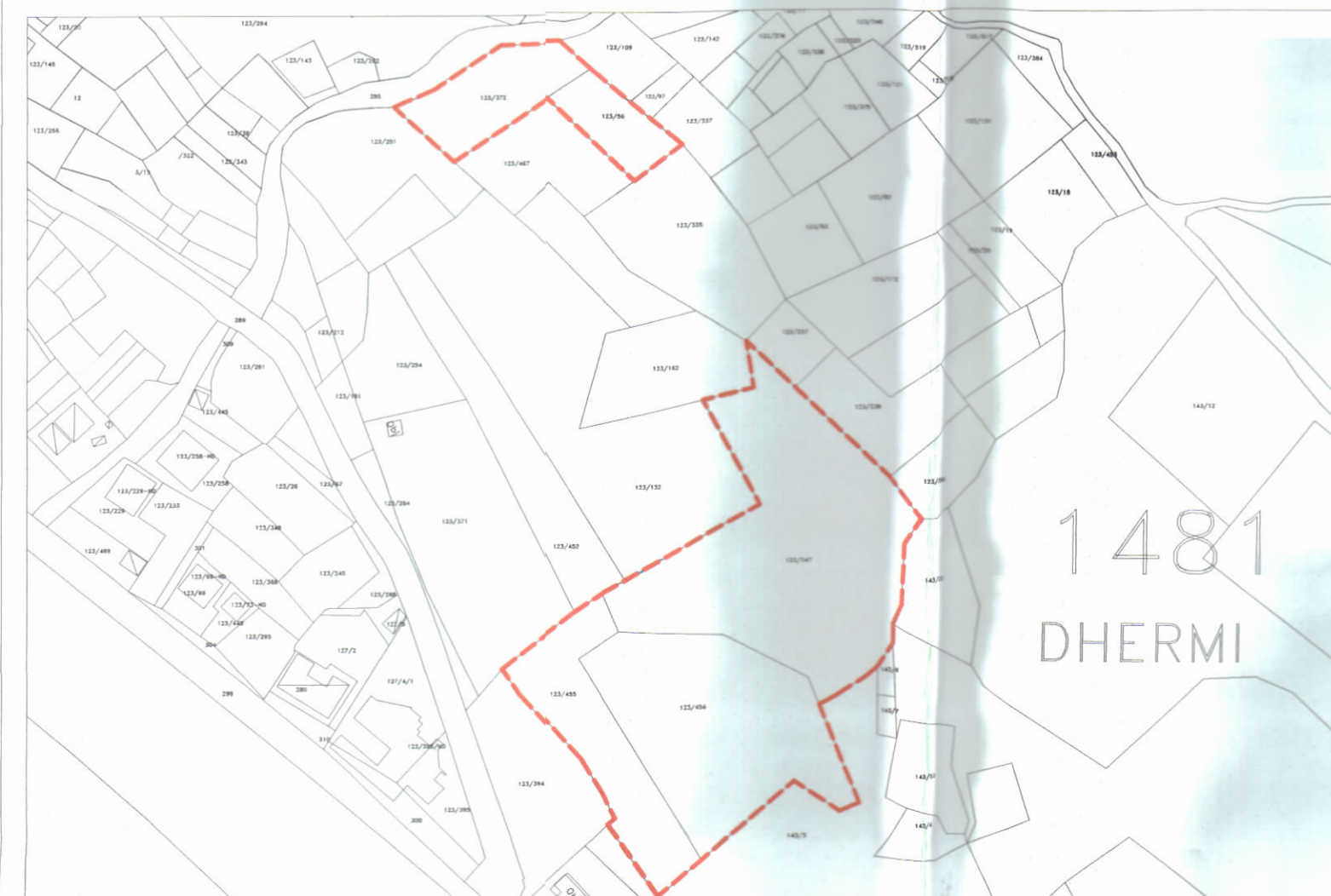
POZICIONI KADASTRAL SHK. 1:2500