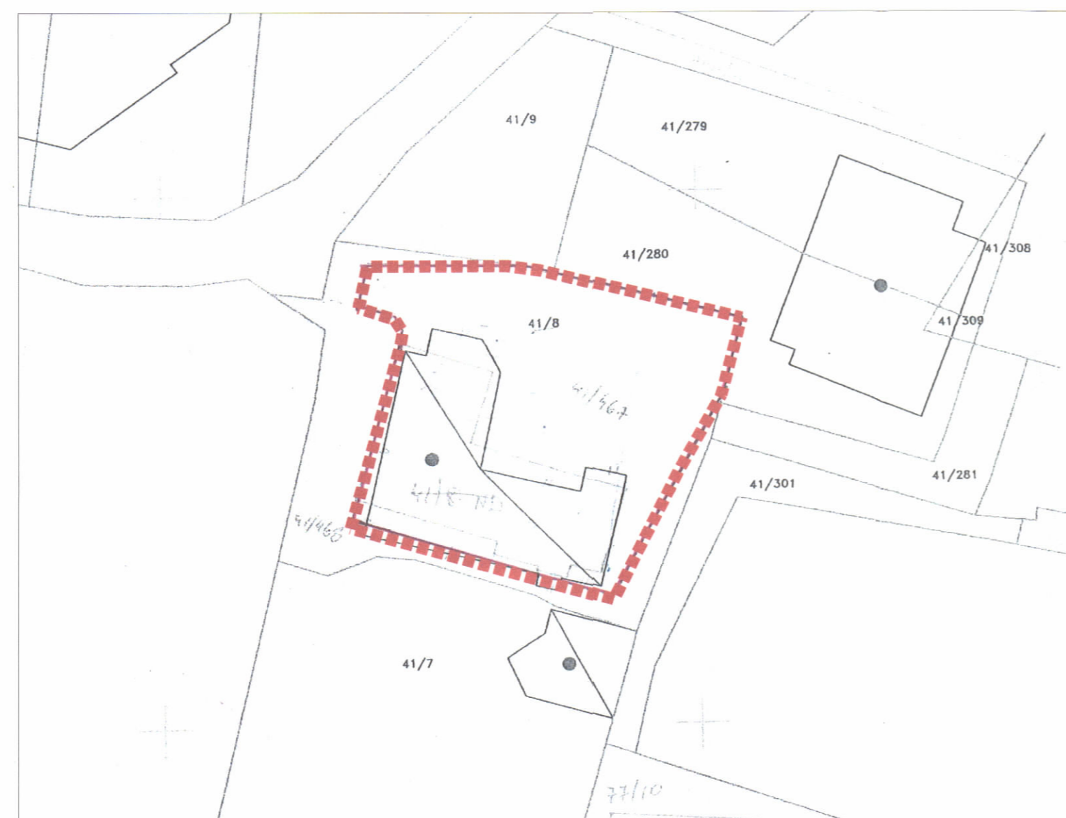
POZICIONI KADASTRAL SHK. 1:500