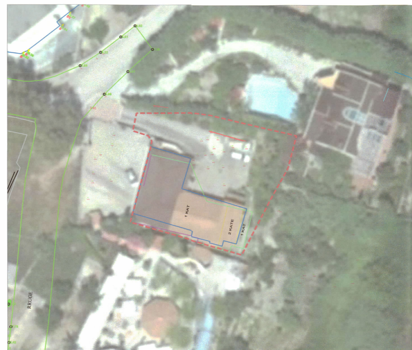
HARTA TOPOGRAFIKE SHK. 1:500