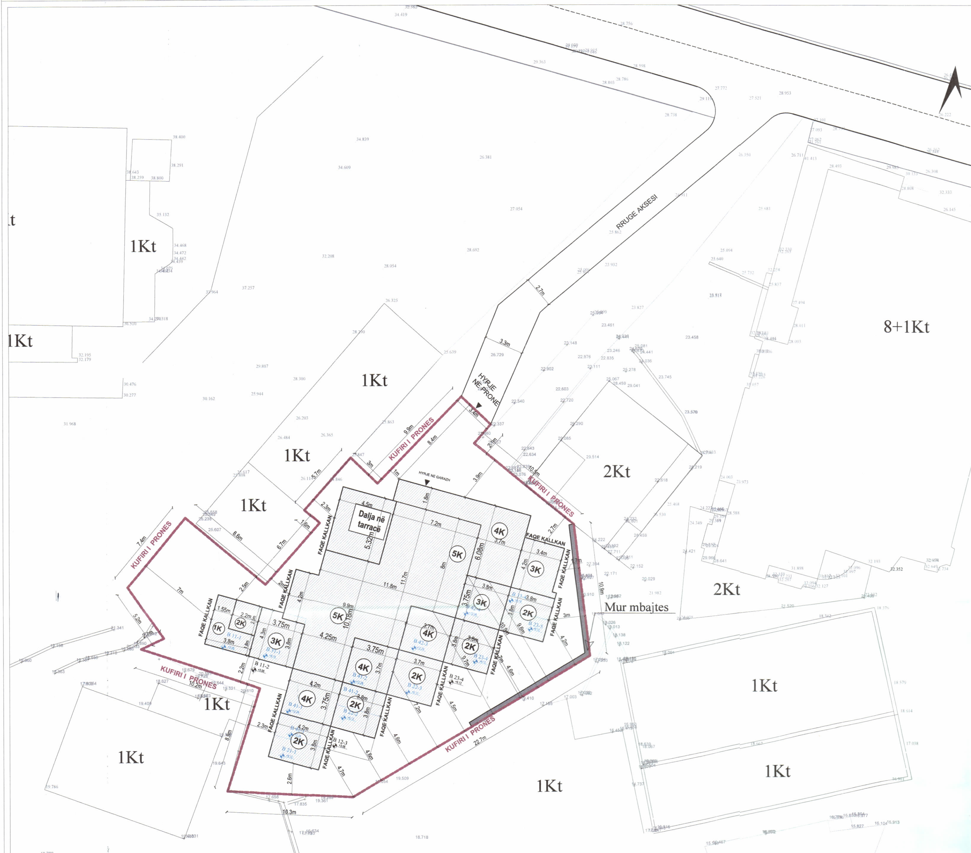
PLANI I VENDOSJES SË STRUKTURËS SHK. 1:200