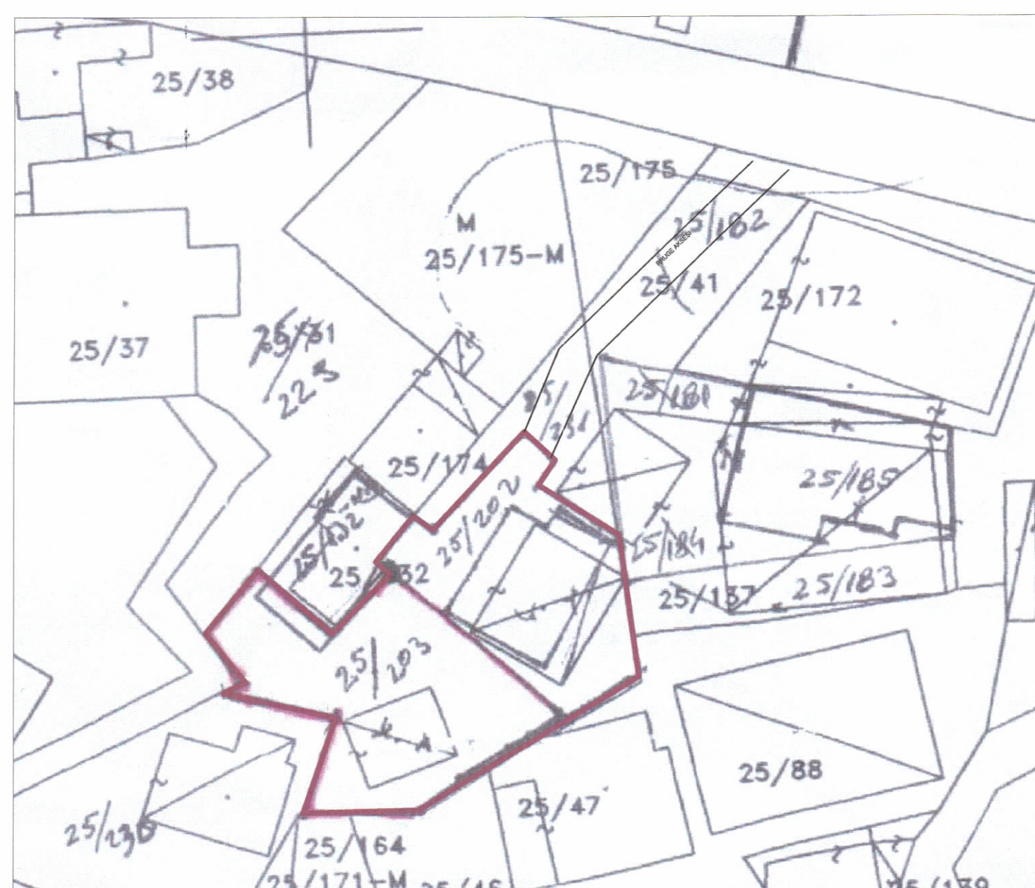
POZICIONI KADASTRAL SHK. 1:500