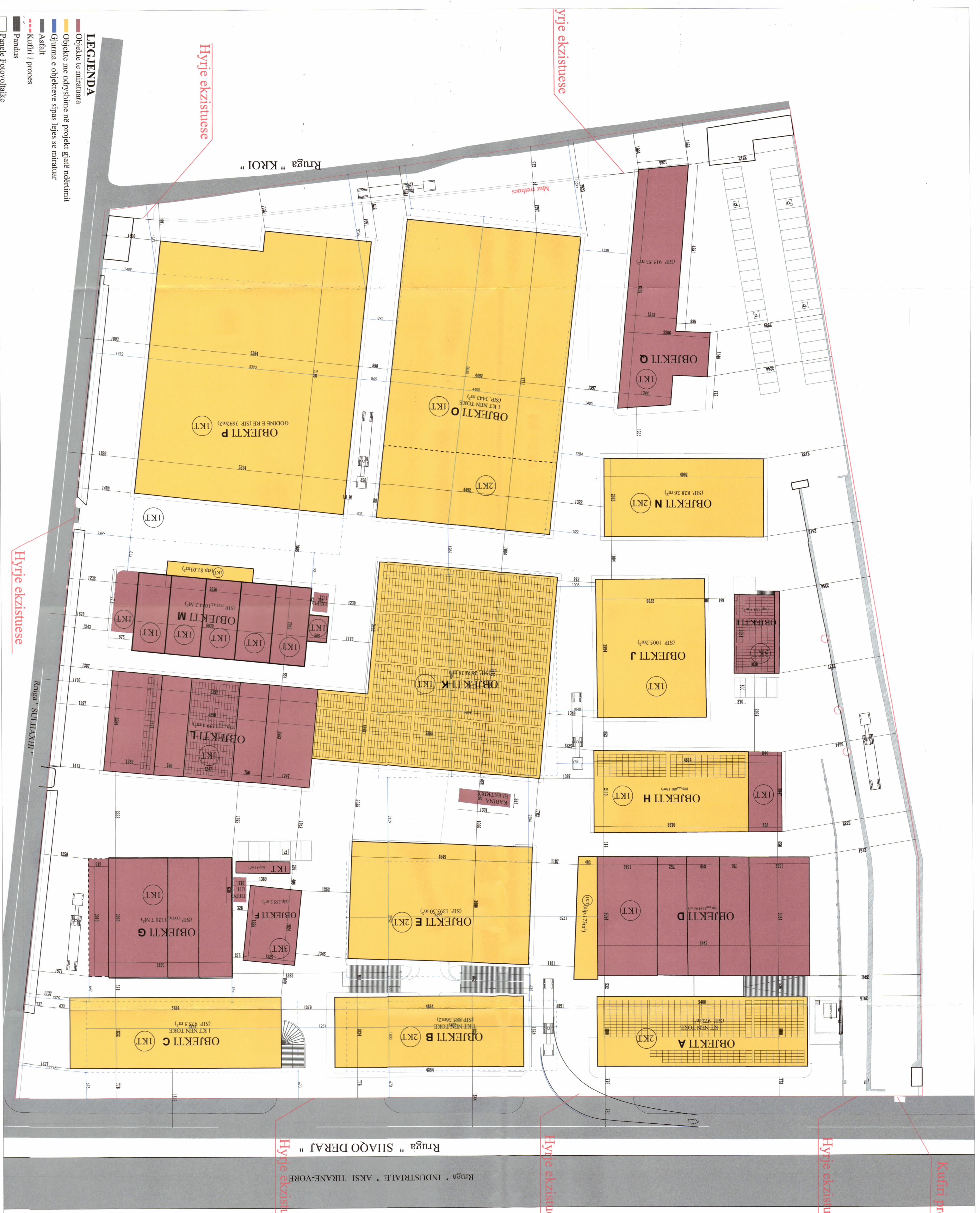
PLANI I VENDOSJES SË STRUKTURËS SHK. 1:500