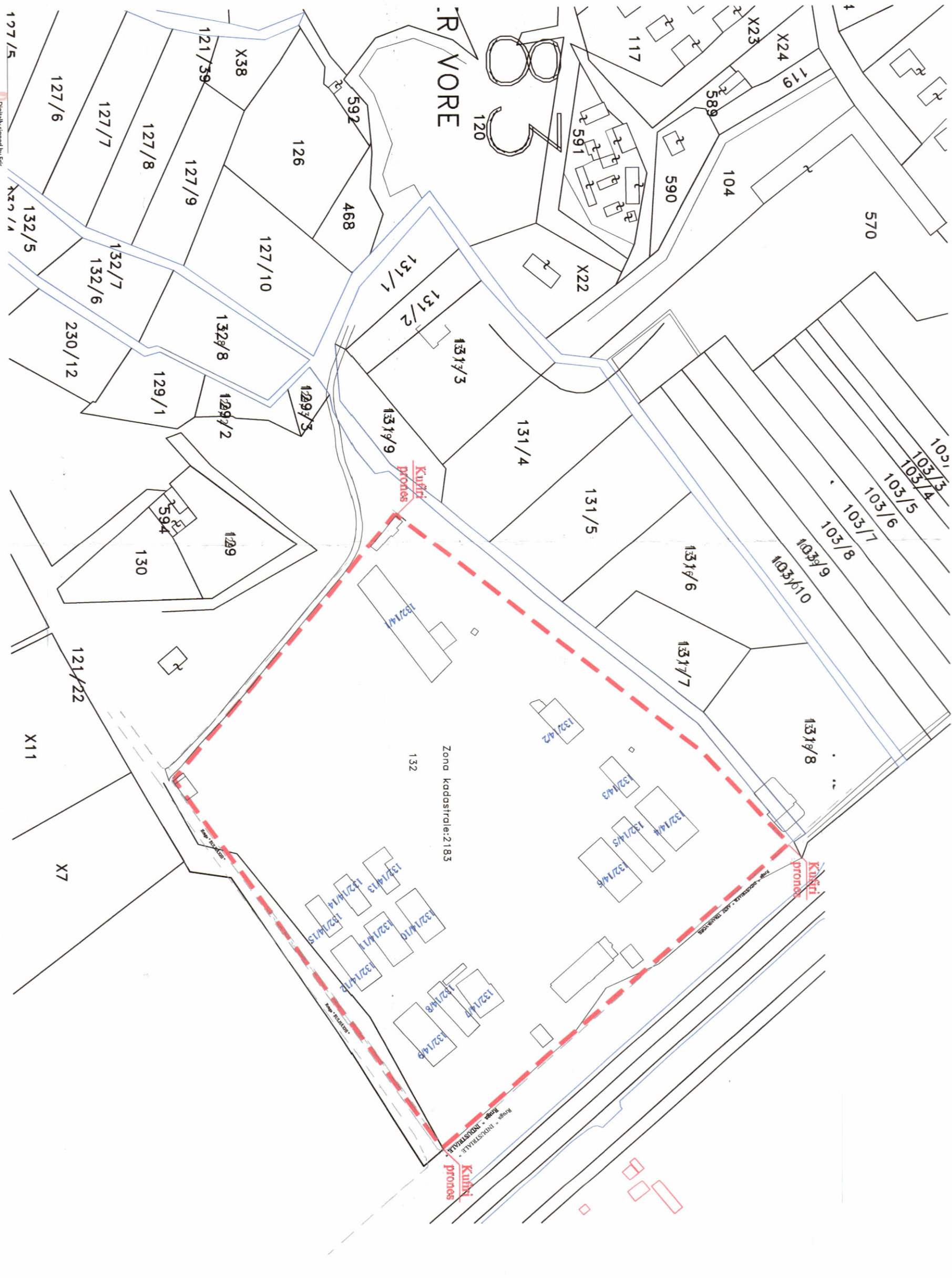
POZICIONI KADASTRAL SHK. 1:2000