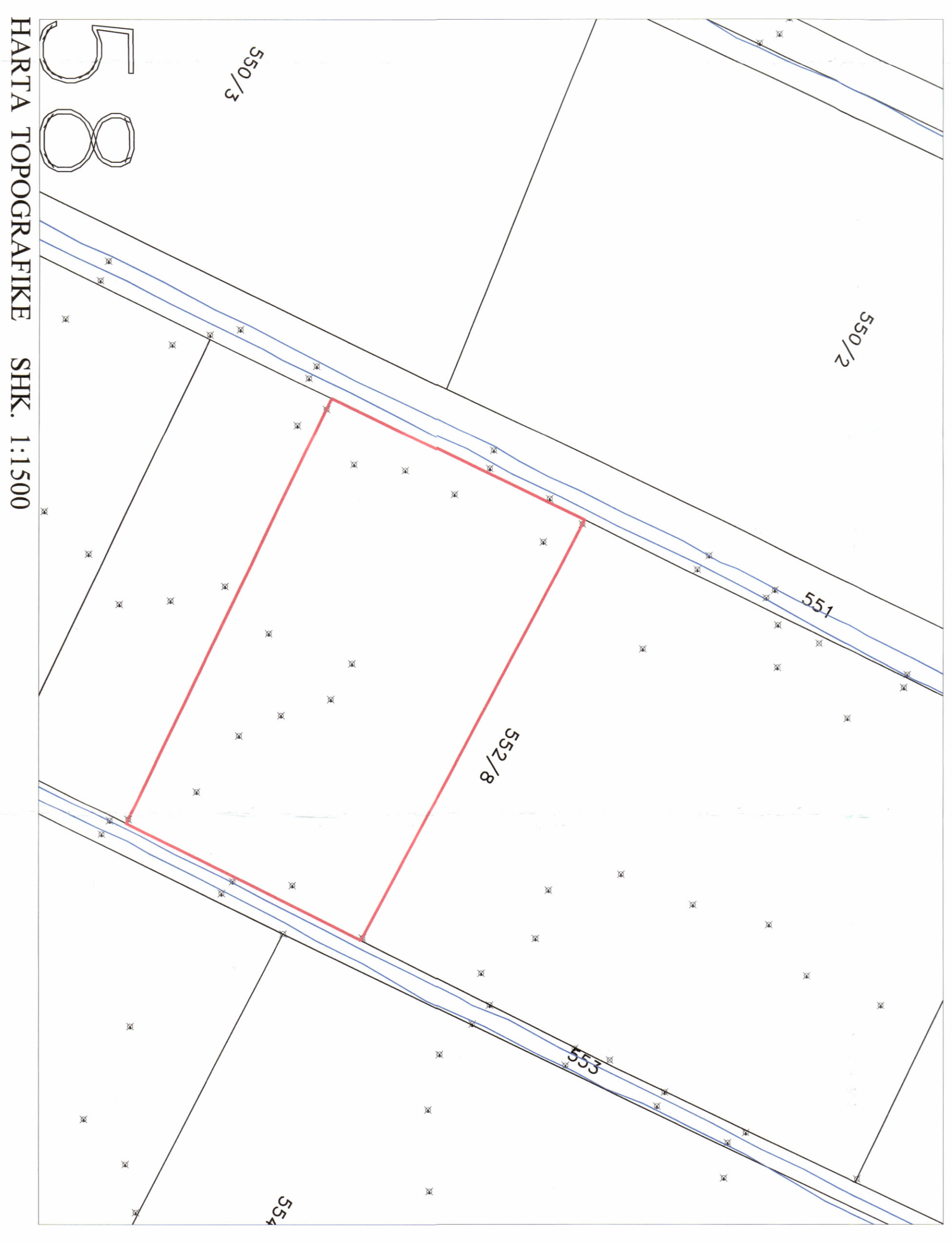
HARTA TOPOGRAFIKE SHK. 1:1500