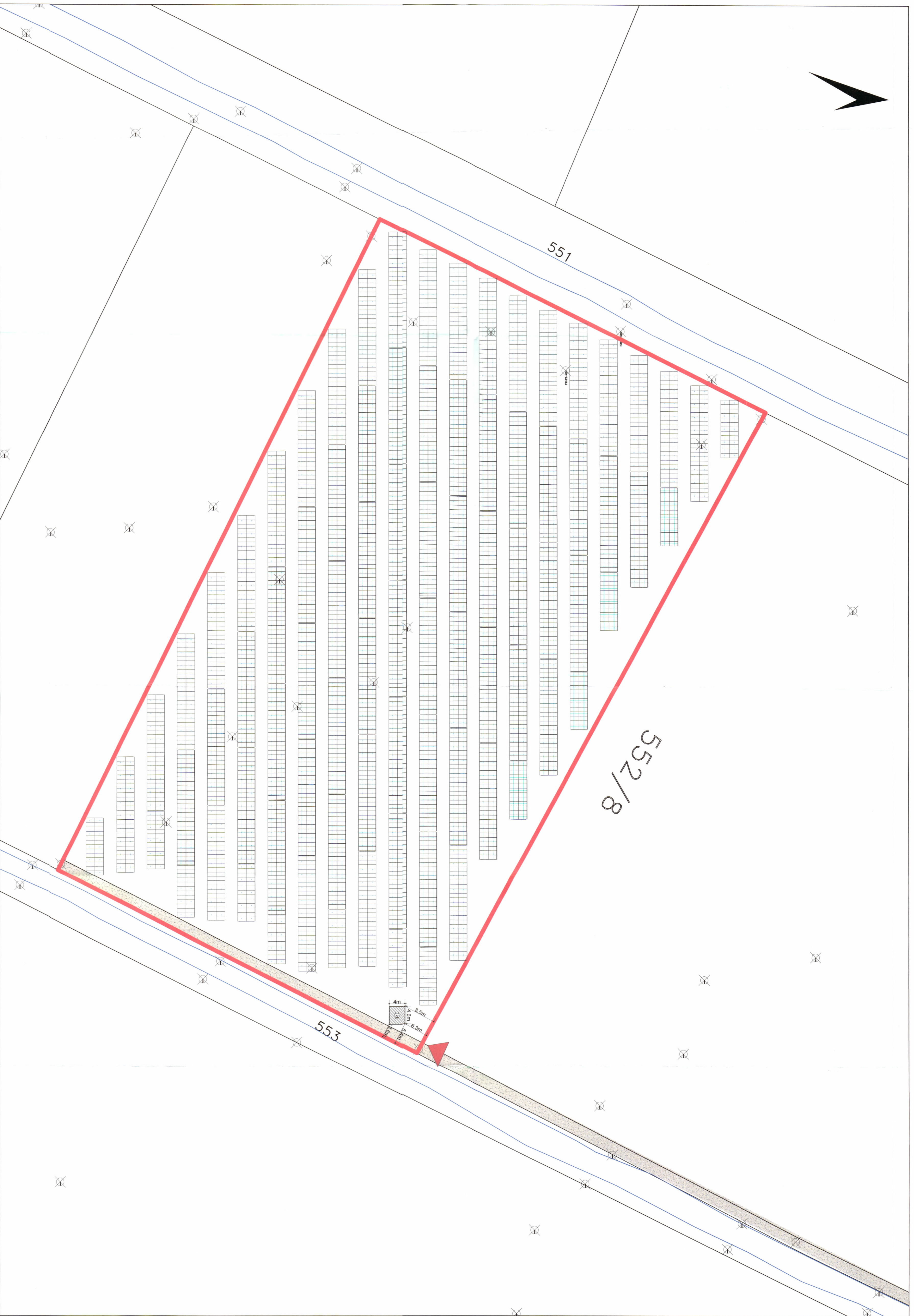
PLANI I VENDOSJES SË IMPIANTIT FOTOVOLTAIK SHK. 1:500