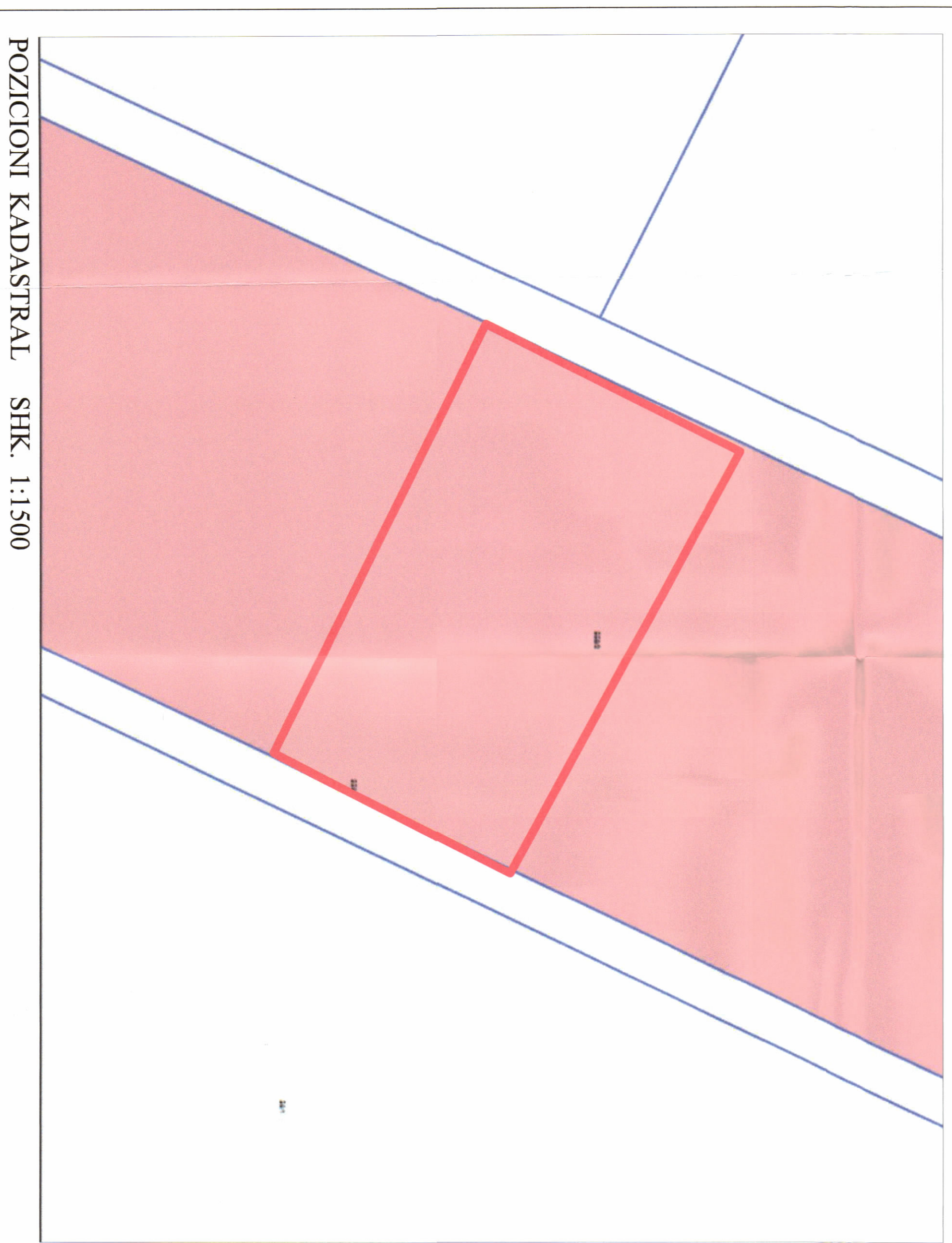
POZICIONI KADASTRAL SHK. 1:1500