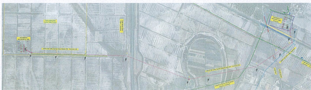
Figura 8. Paraqitje grafike e lidhjes së parkut me infrastrukturën ekzistuese dhe nënstacionin.

Projekti për ndërtimin e impiantit fotovoltaik Sunny Side Solar Park do të zhvillohet në zonën fushore ndërmjet fshatit Povelce dhe Darzezë në njësinë administrative Dërmënas, Fier. Lidhja e impiantit me sistemin energjetik do të realizohet nëpërmjet nënstacionit të ri 220/35/20 kV Sunny Side Energy dhe linjës 220kV me dy qarqe e me pike lidhje nënstacionin 400/220/110 kV Hoxhare. Pozicioni gjeografik i linjës shtrihet në perëndim të qytetit të Fierit, duke filluar nga parku fotovoltaik dhe vijon në drejtimin verior për të arritur në nënstacionin Hoxharë pranë fshatit Topojë. Lartësia mbi nivelin e detit në zonën ku kalon linja varion nga -1 deri në +2 m. Traseja e linjës konsiderohet fushore dhe e lehtë për tu aksesuar.