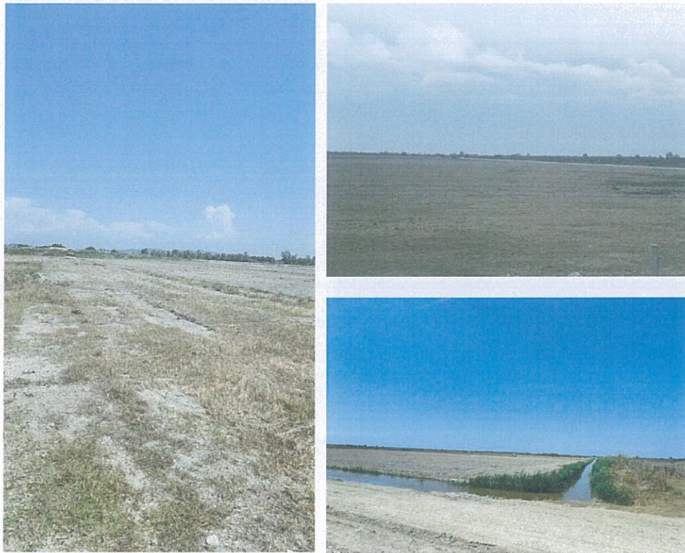
Figura 2. Fotografi të zonës