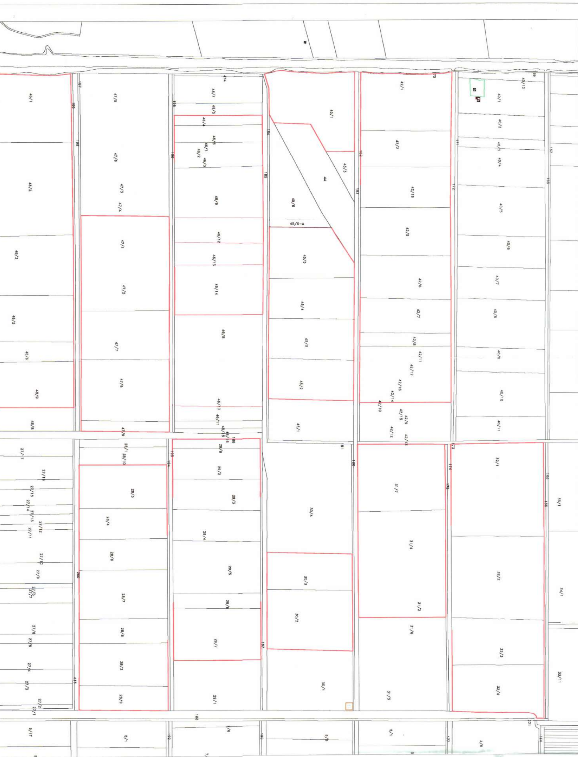
POZICIONI KADASTRAL SHK. 1:5000