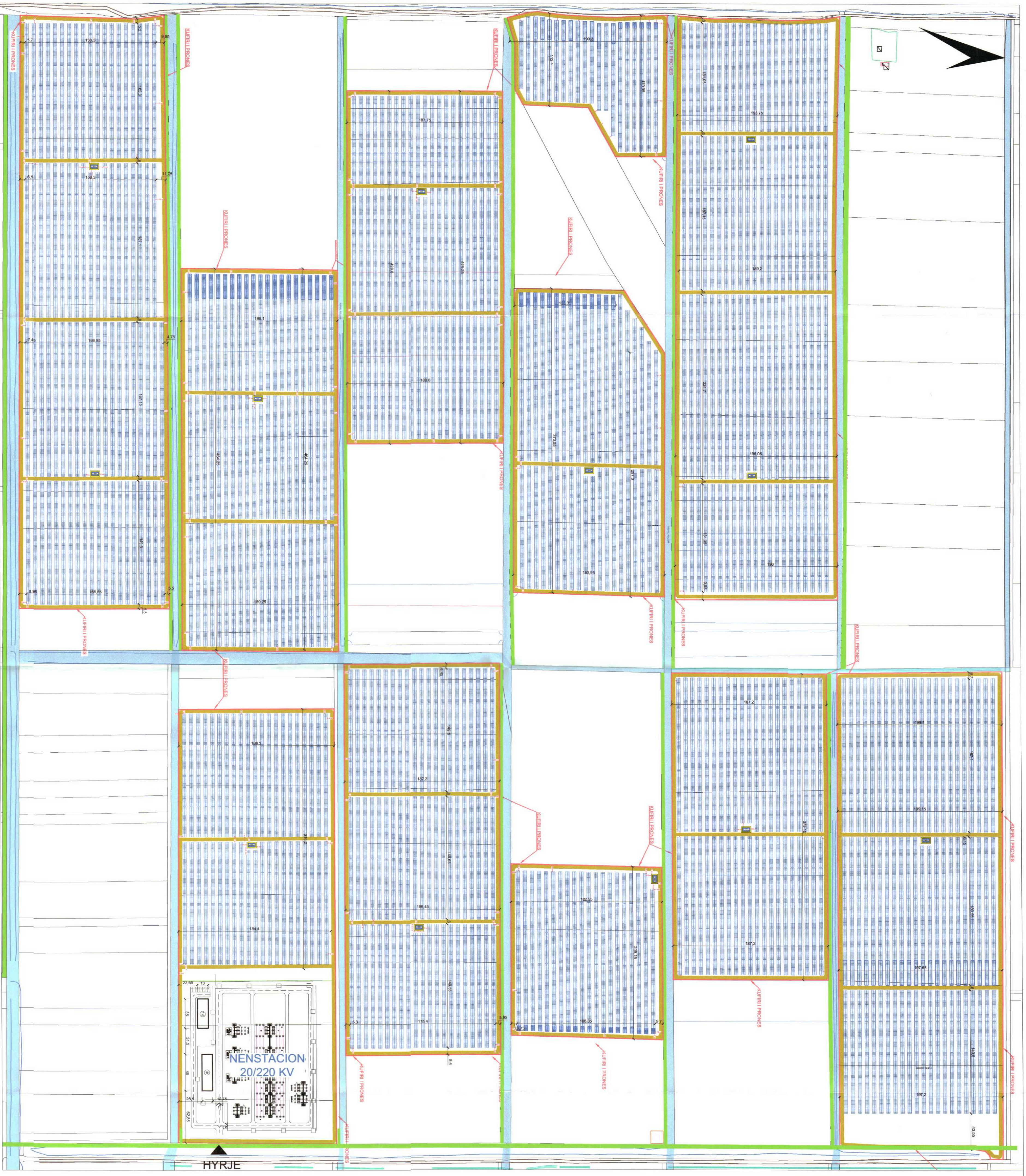
PLANI I VENDOSJES SË STRUKTURËS SHK. 1:2500