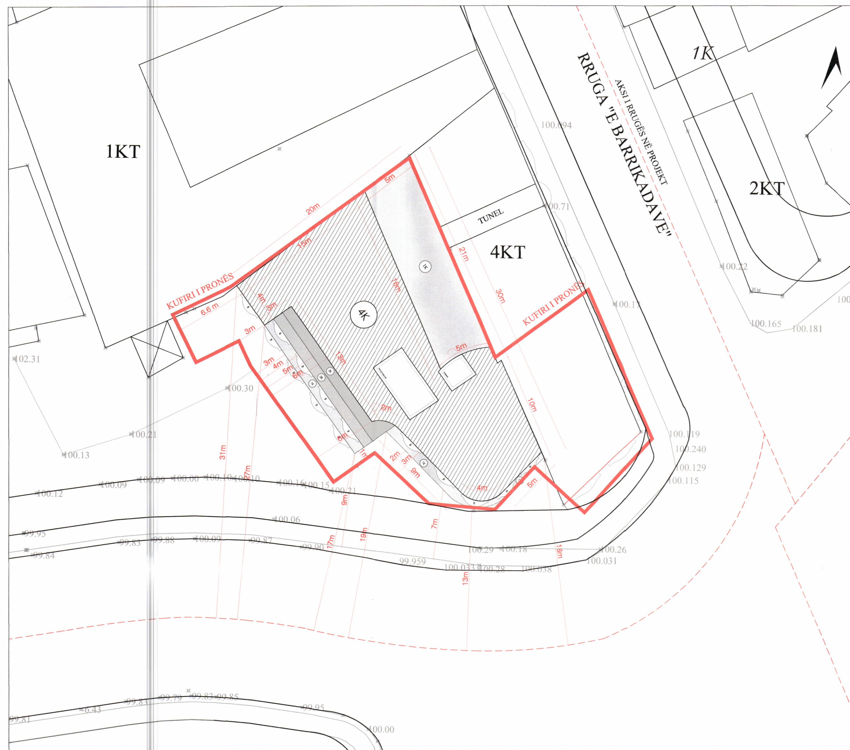
PLANI I VENDOSJES SË STRUKTURËS SHK. 1:200