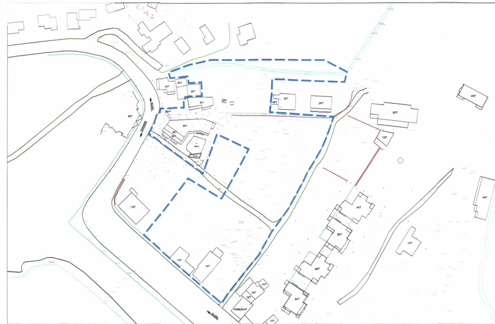
HARTA TOPOGRAFIKE SHK. 1:1500