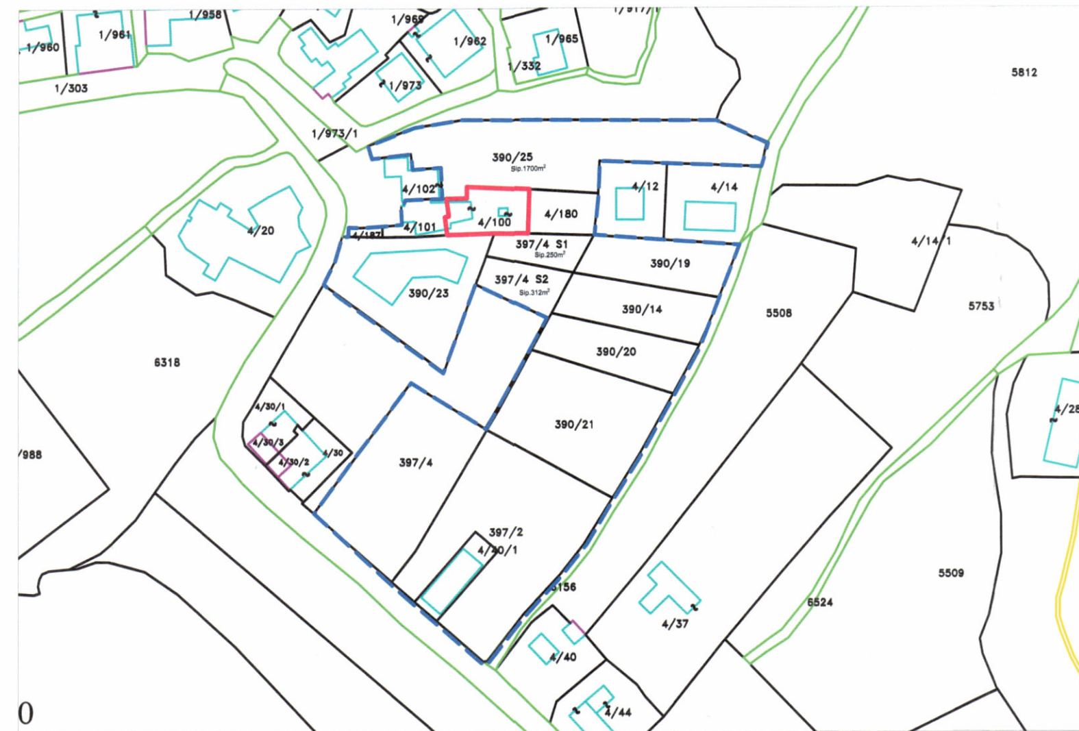
POZICIONI KADASTRAL SHK. 1:1500