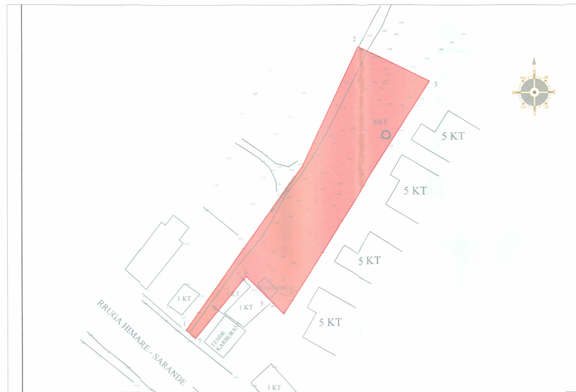
HARTA TOPOGRAFIKE SHK. 1:750