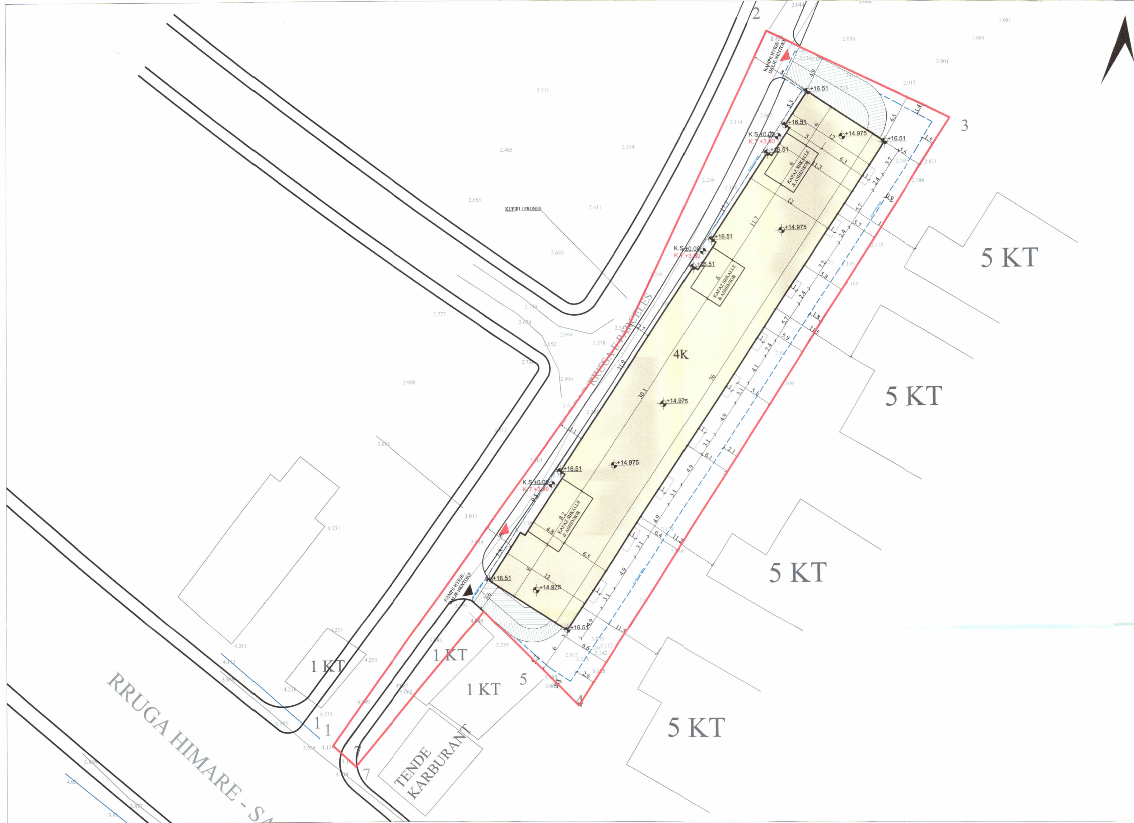
PLANI I VENDOSJES SË STRUKTURËS SHK. 1: 300