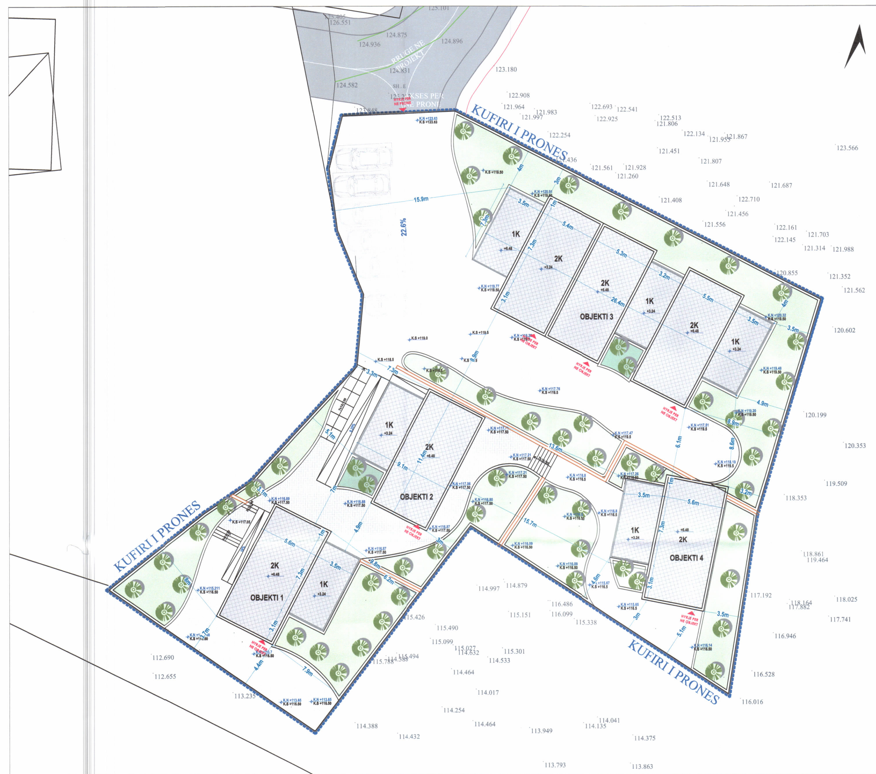
PLANI I VENDOSJES SË STRUKTURËS SHK. 1:200