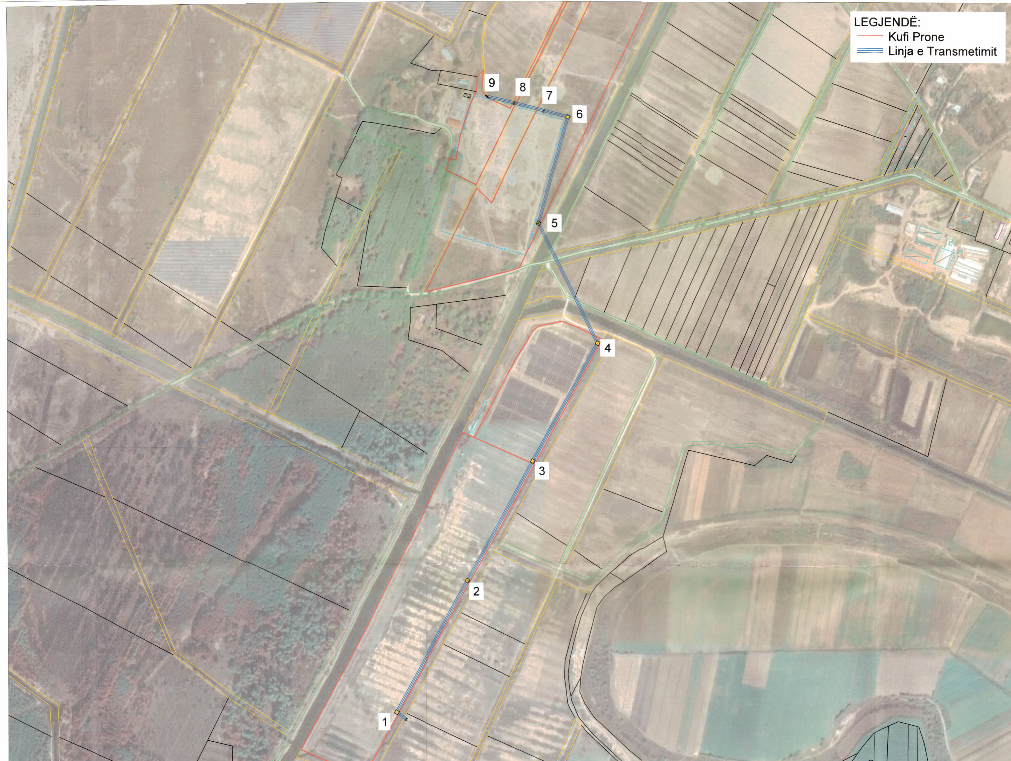
PLANI I VENDOSJES SË STRUKTURËS SHK. 1: 5000