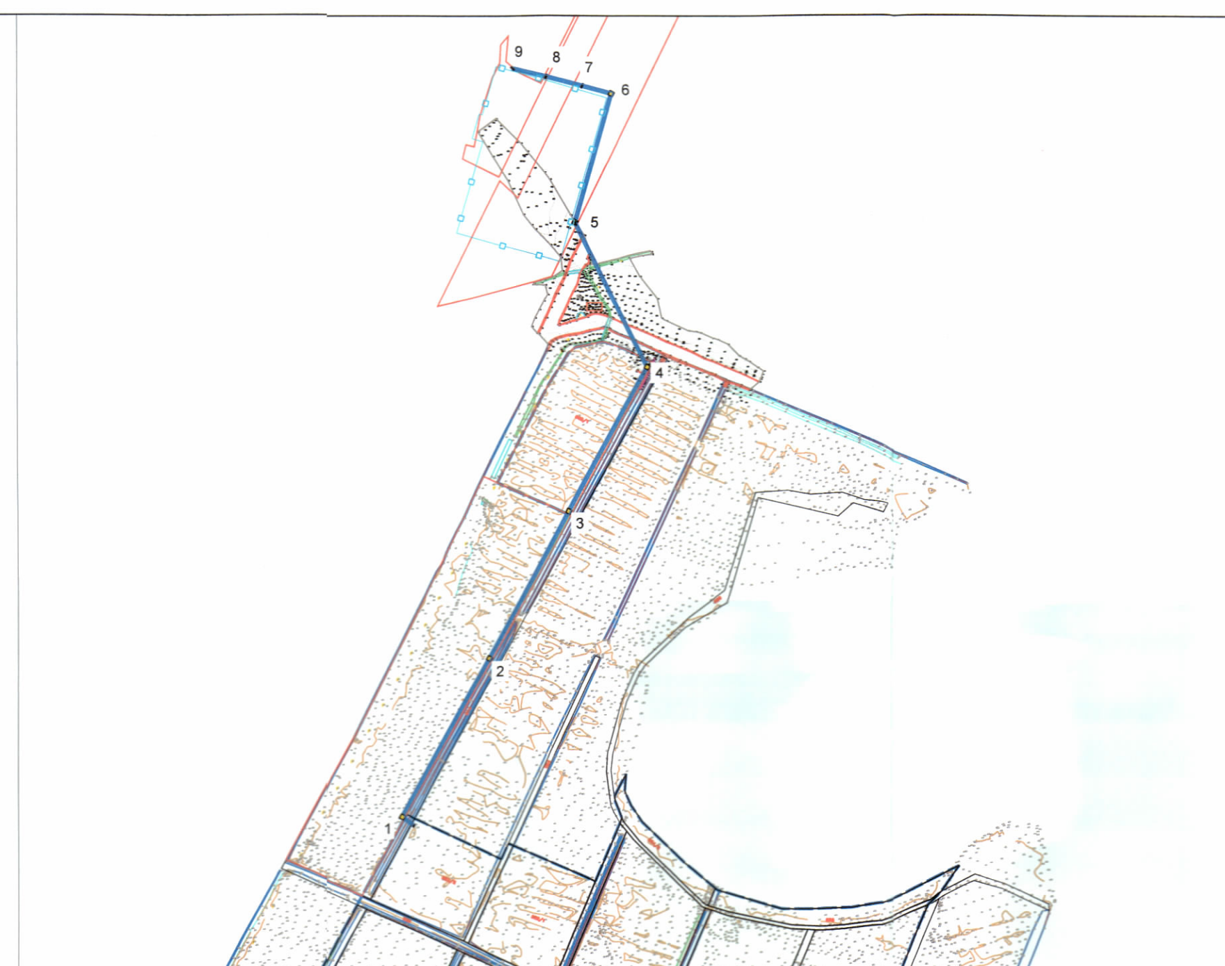
HARTA TOPOGRAFIKE SHK. 1:10,000