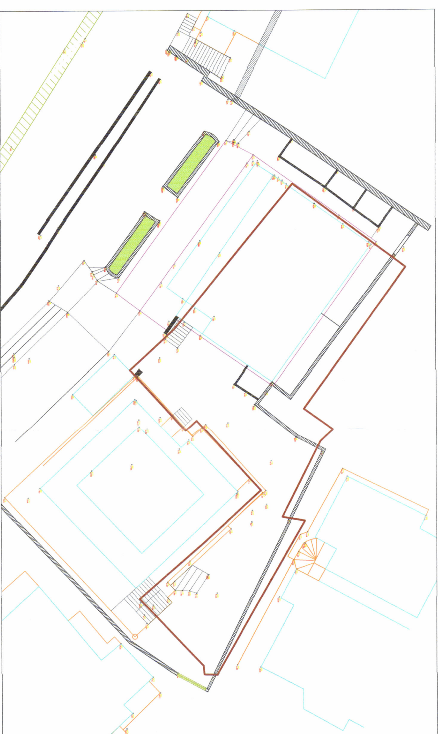
HARTA TOPOGRAFIKE SHK. 1:250