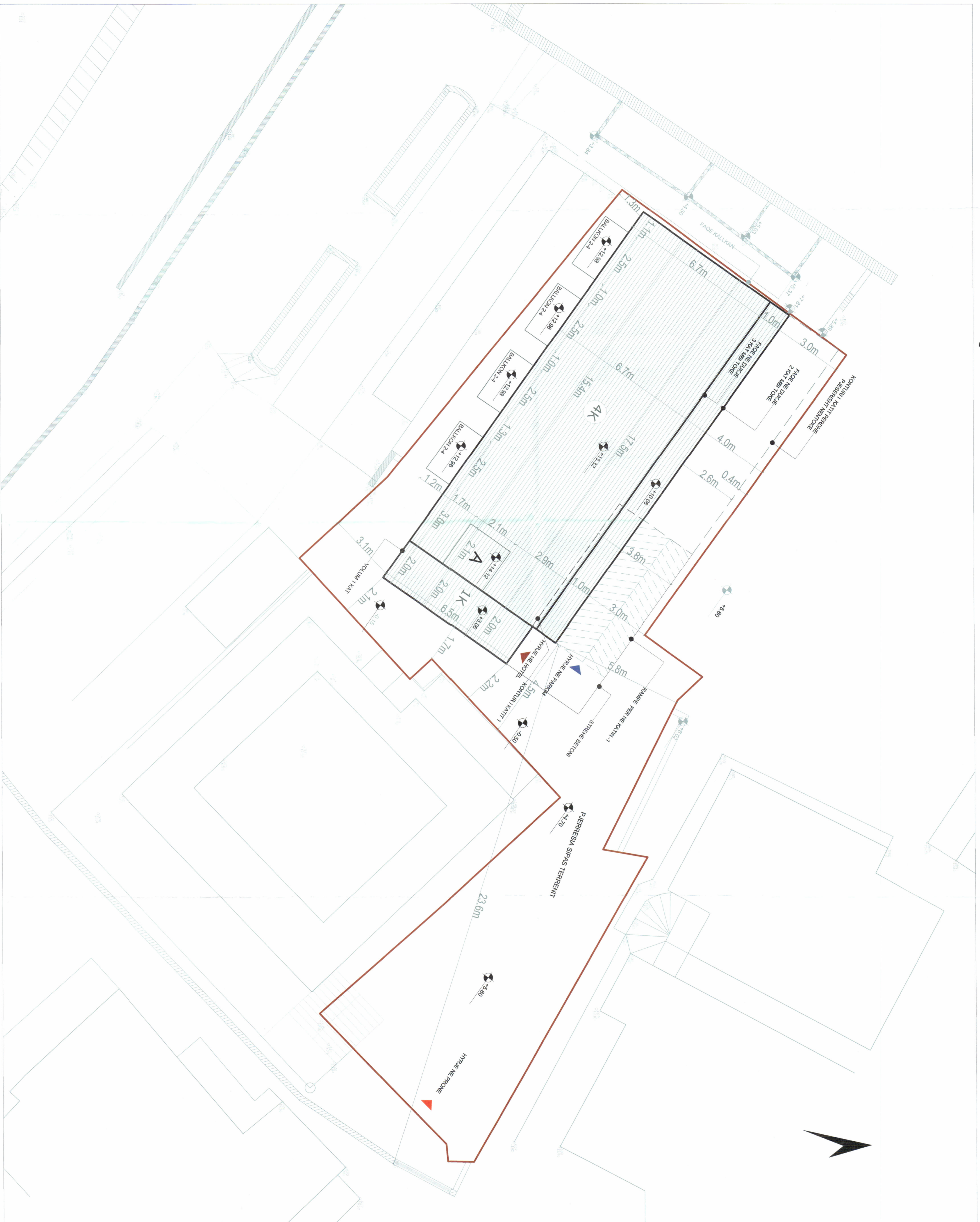
PLANI I VENDOSJES SË STRUKTURËS SHK. 1:100